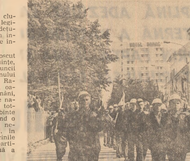
COVASNA: înfrății în muncă, înfrății în coloanele marii noastre sărbători

Coloanele demonstrațiilor clujene au dat glas mândriei legitime de a fi locuitorii județului aflat din nou în fruntea trecerii socialiste desfășurate între județele țării. O mare amploare a cunoscut în județ construcția de locuințe, la dispoziția oamenilor muncii fiind puse, în anii socialismului peste 58 000 de apartamente. Raportul de succes este doborât de marea muncă clujeană — români, maghiari, germani și de alte naționalități și-au reafirmat, totodată, dragostea lor fierbinte față de patrie și partid, dând o nouă înălțare vostacilor lor nestrămutați de a îndoplini, în continuare, exemplar sarcinile ce le revin din Programul partidului de înflorire continuă a României socialiste.