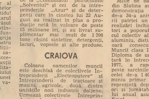
SLATINA: înfrății în muncă, înfrății în coloanele marii noastre sărbători

Miile de oameni ai muncii din Slatina au dus cu ei la demonstrația prilejului de cea de-a 34-a aniversare a eliberării patriei un bogat buchet de realizări închinare marii sărbători a poporului român. Harnicul colectiv al întreprinderii de construcții de mașini și utilaje tehnologice de la întreprinderea „Electromotor” și „Electrotimis”, colectivele întreprinderilor „1 Iunie” și „Bumbacul”. Acestora li s-au alăturat chimiștii de la Combinatul petrochimic „Solventul” și cei de la întreprinderea „Azur” și de detergenți care în cinstea lui 23 August au realizat în plus o producție netă în valoare de peste 15 milioane lei, și au livrat suplimentar mai mult de 1 200 tone rășini sintetice, detergenți, lacuri, vopsele și alte produse.