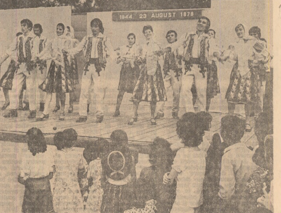
1944 23 AUGUST 1978