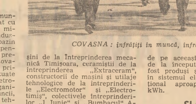
COVASNA: înfrății în muncă, înfrății în coloanele marii noastre sărbători

Demonstrația oamenilor muncii din Valea Jiului a relevat cu pregnanță abnegația cu care minerii și celelalte colective industriale din acest important bazin carbonifer au lăsat muncesc pentru transportarea în fața a prețioaselor indicații date de tovarășul Nicolae Ceaușescu, cu prilejul vizitei de lucru efectuate anul trecut în municipiul Petroșani, privind mai buna organizare a producției și a muncii, extinderea mecanizării și a tehnologiilor moderne. Minerii, ceilalți oameni ai muncii din acest important bazin carbonifer al țării au dat glas sentimentelor lor de dragoste față de Partidul Comunist Român și secretarului general al partidului, tovarășul Nicolae Ceaușescu, manifestându-și și cu acest prilej, profunda lor recunoștință pentru grija pe care partidul și statul nostru o acordă îmbunătățirii condițiilor de muncă și de viață ale oamenilor muncii. Dintre succesele raportate de participanții la demonstrație notăm realizarea, pe ansamblul municipiului Petroșani, în 7 luni a unei producții suplimentare, în valoare de peste 33 700 000 lei.