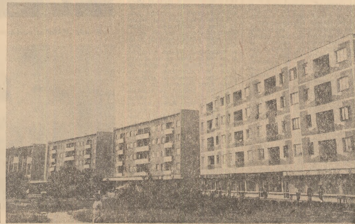
Construcții noi în Turnu Măgurele