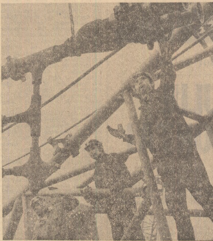
Asemeni șantieriştilor, constructorii de utilaj petrolier urcă pe schele, purtînd mindria realizărilor de prestigiu