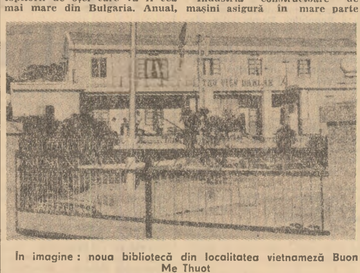
In imagine: noua bibliotecă din localitatea vietnameză Buon Me Thuot

Nu mai în cursul ultimilor doi ani — arată agenția — Brigăzile tineretului voluntari au construit 46 de noi comune economice și nouă importante obiective hidroenergetice. În prezent, ele participă la crearea a peste 20 de ferme de stat în provinciile Hanoi, Vinh, Thanh Hoa, Lam Dong, Dong Nai, Kien Giang, precum și în suburbia Hanoiului.