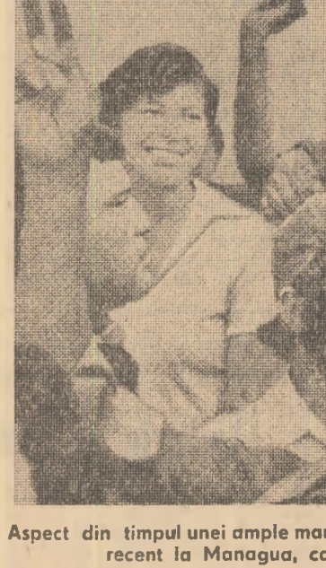
Aspect din timpul unei ample manifestații antidictatoriale desfășurate recent la Managua, capitala statului Nicaragua

Există totuși și posibilitatea unei schimbări de putere în cadrul parlamentarului, și atunci alternativa se pare că va fi convocarea de alegeri generale anticipate în interval de 90 de zile. Perspectiva formării unui „guvern prezidențial” este privită cu reticențe puternice la Lisabona.