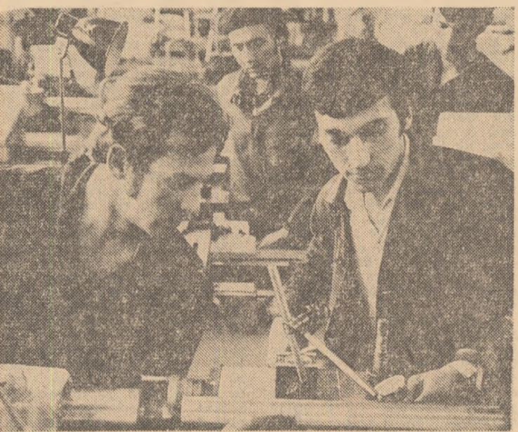
La întreprinderea de strunguri — Arad

În cadrul acțiunilor inițiate în unitățile industriale metalurgice pentru diversificarea sortimentelor din oțel și aliaje, Combinatul metalurgic din Cimpia Turzii a început, anul acesta, să producă șase noi mărci de oțeluri aliate și înalt aliate, cu utilizări în construcția de automobile, utilaj petrolier, mașini-unelte, scule etc. Oțelurile de aici au reușit, pe această cale, să ridice la peste 70 la sută ponderea oțelurilor aliate și înalt aliate în totalul producției.