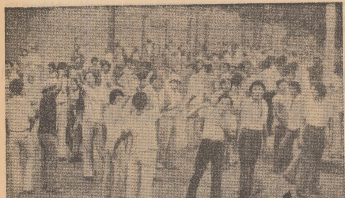
NICARAGUA — În cadrul opoziției tot mai hotărâte a celor mai largi categorii sociale față de politica dictatorială a regimului Somoza, tineretul constituie o categorie deosebit de activă. În fotografie: aspect din timpul unei ample manifestații a tinerilor împotriva dictaturii, pentru înnoiri democratice

Agenția Associated Press menționează că evoluțiile precizate la produsele alimentare, ca și la alte categorii de bunuri din ultimul timp au făcut ca în perioada aprilie-iunie rata anuală a inflației în S.U.A. să devină de 10,7 la sută.