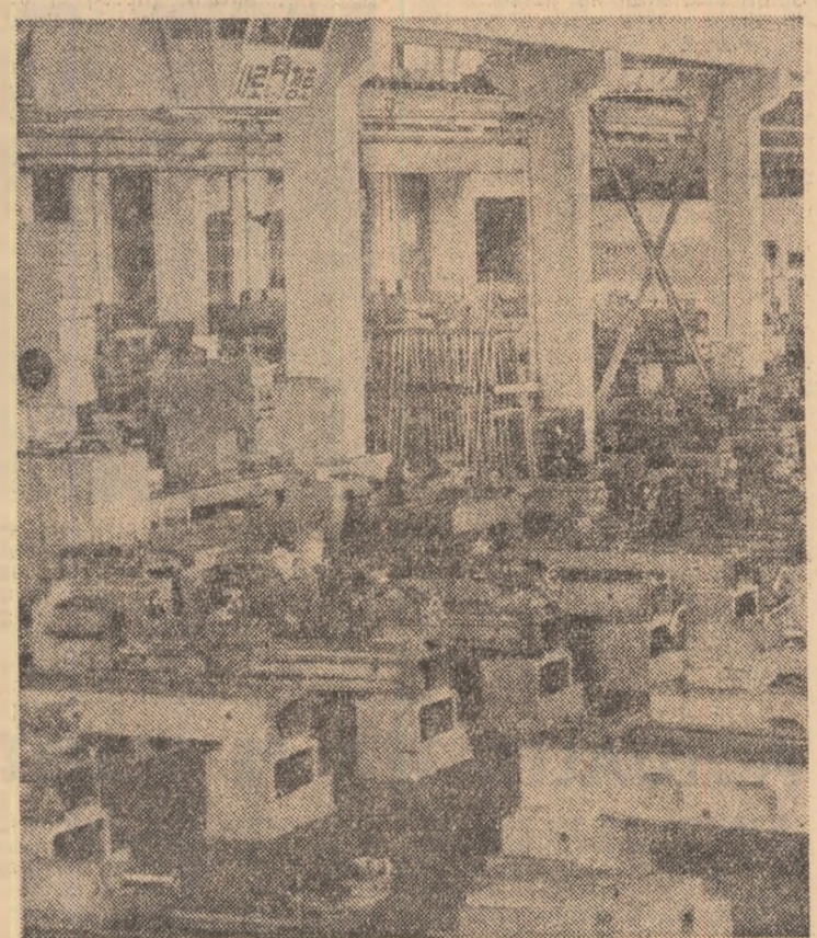
R.P.D. COREEANA — Imagine de la Uzina de mașini-unelte din Koesung, unul dintre pilonii industriei țării

Programul misiunii a fost îndeplinit integral — s-a comunicat ziaristilor prezenți la centrul de dirijare a zborurilor cosmice de lângă Moscova. Fototeca spațială a fost îmbogățită cu serii de imagini multizoționale ale unor întinse porțiuni ale suprafeței terestre și Oceanului planetar, de natură să întinsească cercetarea și punerea în valoare a unor resurse naturale, ca și ale diverselor „etaje” ale atmosferei, inclusiv cele inferioare, vizînd cunoașterea stării actuale a mediului ambiant. Totodată, au fost realizate, în condițiile zborului cosmic, experimente tehnologice, în scopul determinării influenței împonderabilității asupra formării de noi materiale metalice și nemetalice și s-au obținut date noi asupra caracteristicilor dinamice ale proceselor fizice din atmosfera Pămîntului, comitent cu efectuarea unei serii de cercetări medico-biologice, privind influența factorilor zborului cosmic asupra organismului uman și a dezvoltării unor componente biologice.