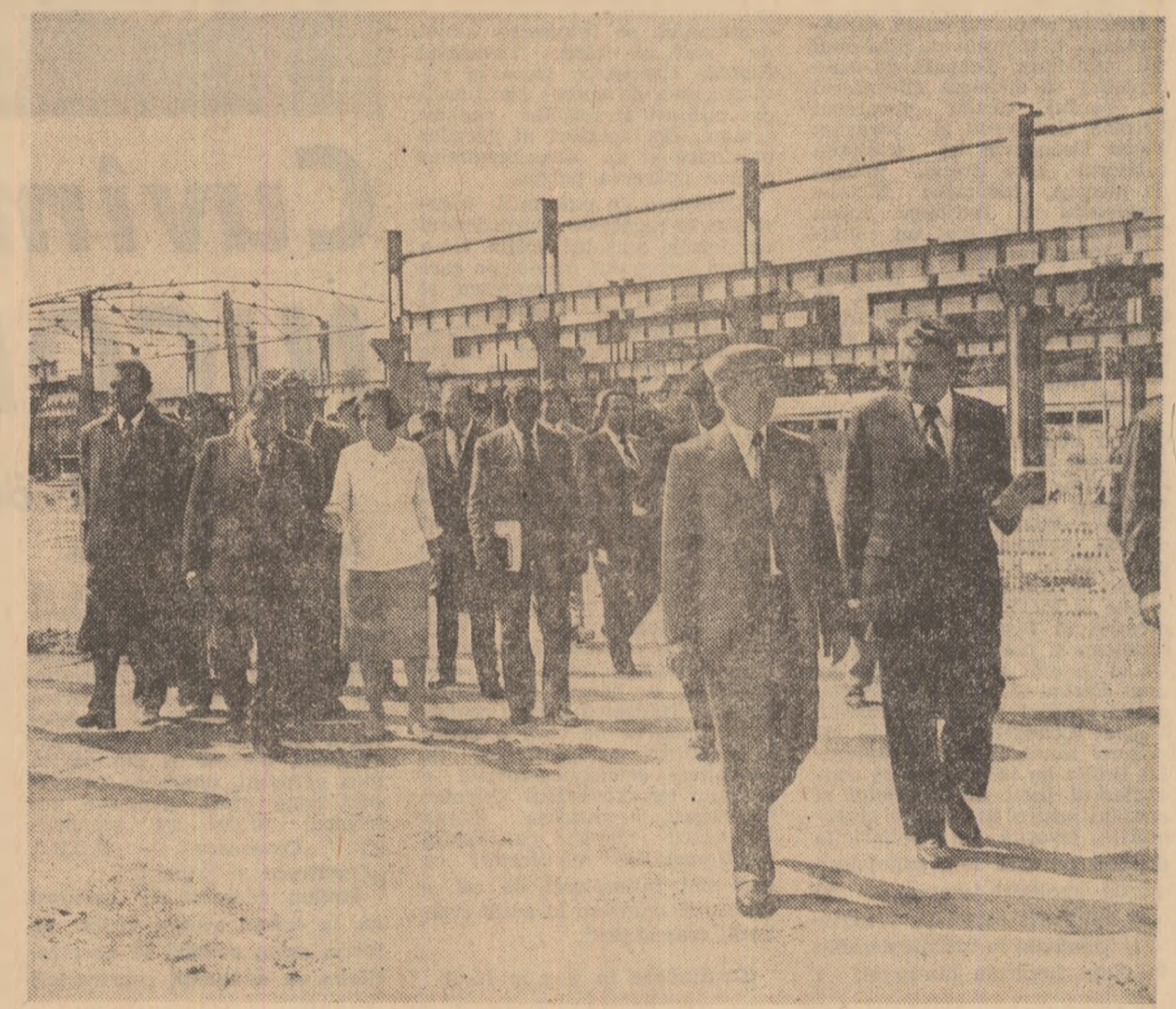
La Întreprinderea „Laminorul”