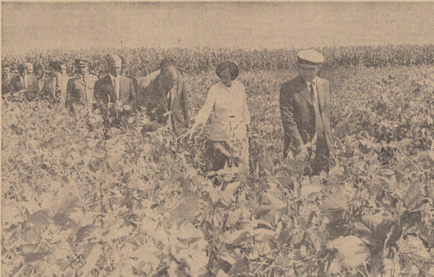
Un nou și rodnic dialog cu colectivele de oameni ai muncii din întreprinderi industriale și unități agricole