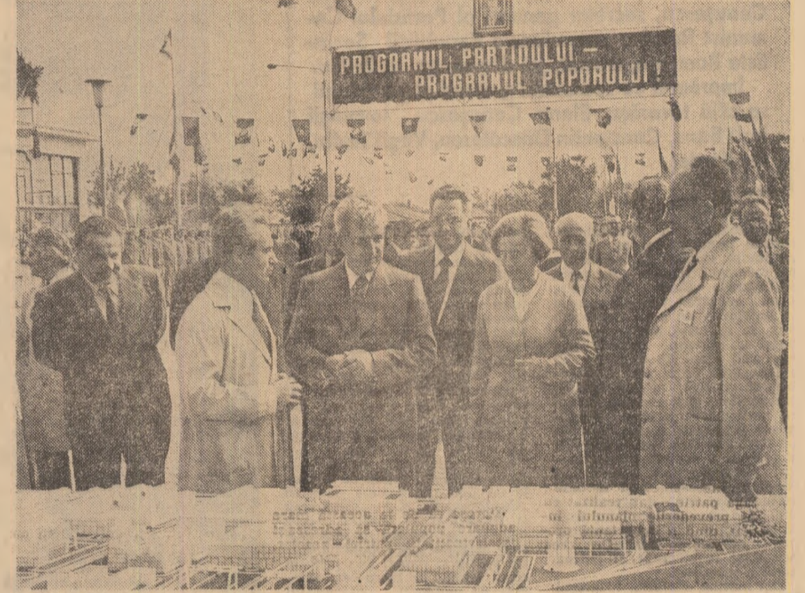
La Întreprinderea de utilaj greu „Progresul”