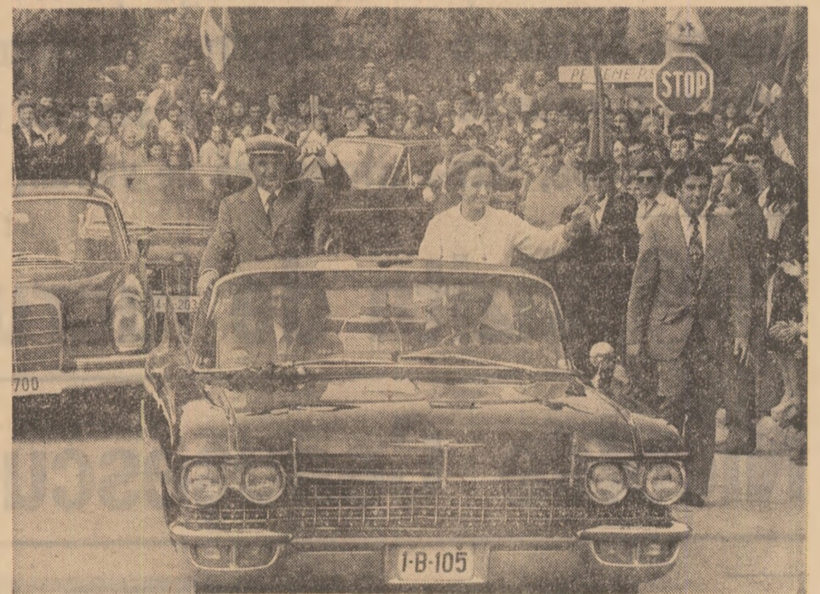
Atmosferă entuziastă pe întregul traseu al vizitei