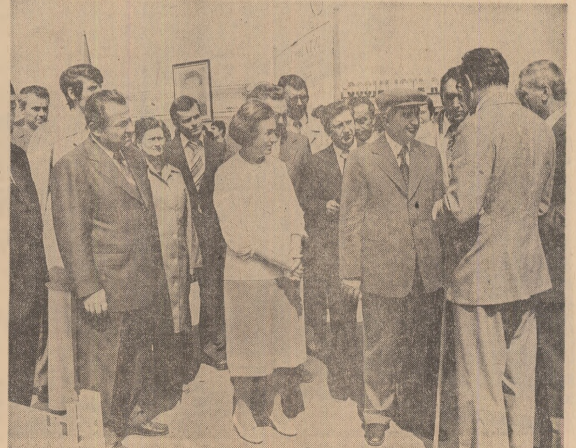
La Combinatul de celuloză, hirtie și fibre artificiale