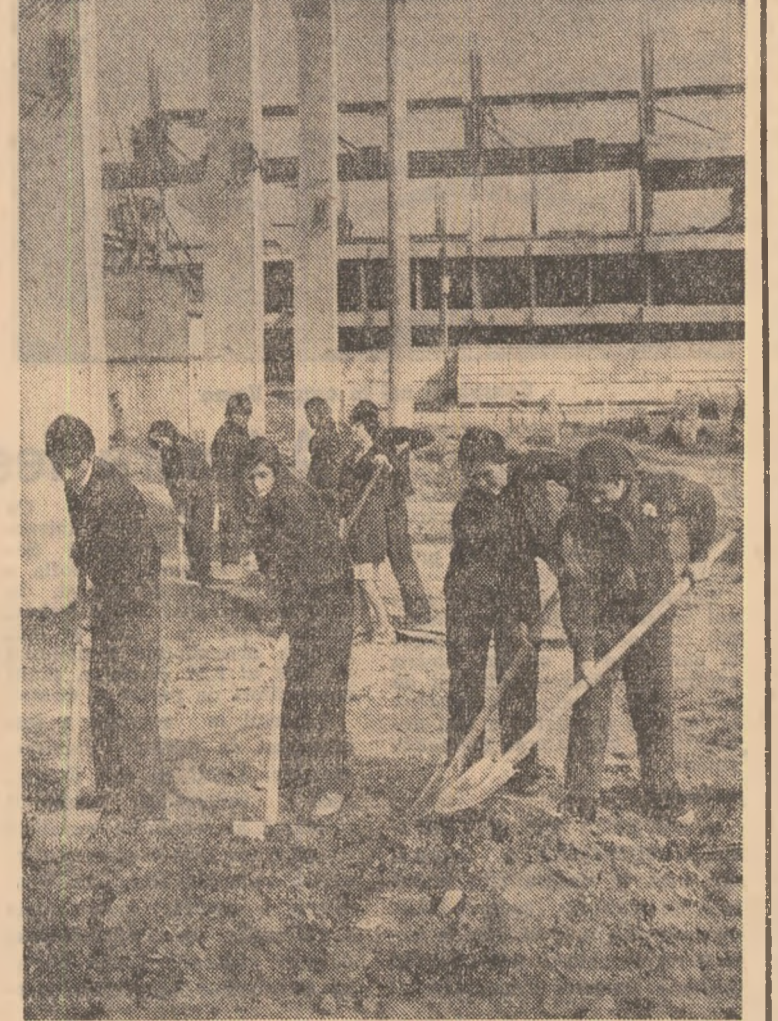
Pe șantierul județean de muncă patriotică de la întreprinderea de mase plastice — Buzău.

Mesajul artei interpretative românești a fost purtat anul acesta, în diverse țări ale lumii și de ansambluri școlare care au participat la diferite manifestări internaționale menite să promoveze schimbul bog de valori culturale. La Festivalul internațional de muzică de la Bydgoszcz — Polonia, unde au participat elevi din Bulgaria, Cehoslovacia, Franța, Polonia, România, Ungaria și U.R.S.S., orchestra de cameră a Liceului de artă nr. 1 din București a obținut premiul I „Lira de aur”. De asemenea, corul Liceului pedagogic din Deva, laureat al Festivalului național „Cîntarea României” a oferit reușite concerte la Festivalul „Tineretul și muzica de la Viena”. Programul a cuprins o selecție din creația corală românească și universară, clasică și contemporană. În această perioadă, o formație a Liceului Industrial nr. 1 din Reșița a reprezentat la „Festivalul artelor”, de la Essex — Marea Britanie, frumusețea cîntecului, dansului și portului popular din diferite zone ale patriei.