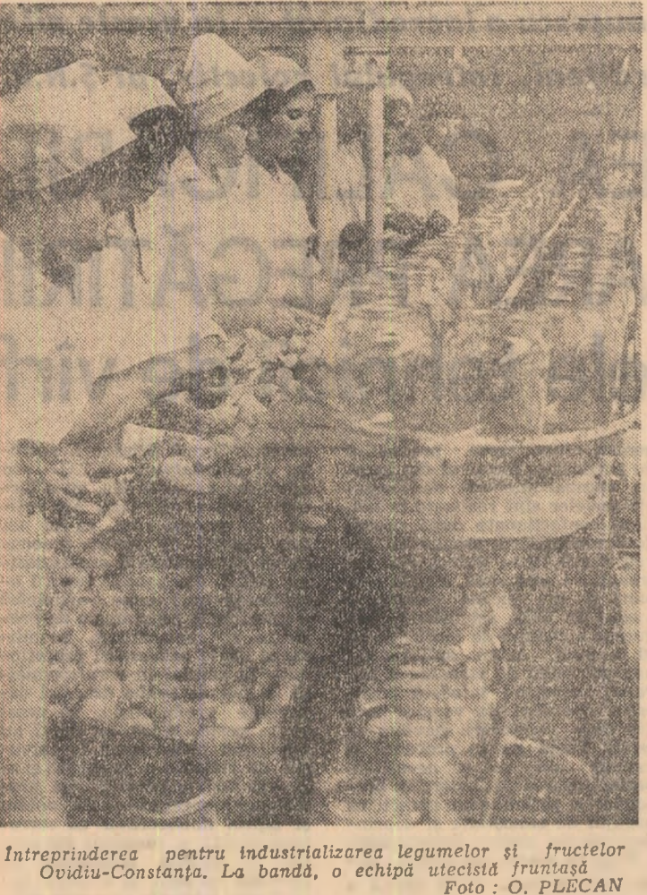
Intreprinderea pentru industrializarea legumelor și fructelor Ovidiu-Constanța. La bandă, o echipă uicată fructată.

LA TG. MUREȘ: Amfiteatrele și laboratoarele studențești GATA PENTRU ÎNCEPEREA CURSURILOR Centrul universitar Tg. Mureș este astăzi gata să înceapă activitatea științifică și didactică. Într-o sală de spectacole din cadrul teatrului de operă și balet, s-a desfășurat o sesiune de lucru în care s-a discutat despre necesitățile pregătirii cadrelor de subingineri. Am primit un substațial sprijin din partea Ministerului Industriei Construc- Investiții și muncă pentru adecvarea spațiilor de învățământ necesității pregătirii cadrelor de subingineri. Am primit un substațial sprijin din partea Ministerului Industriei Construc- LA TG. MUREȘ: Amfiteatrele și laboratoarele studențești GATA PENTRU ÎNCEPEREA CURSURILOR Centrul universitar Tg. Mureș este astăzi gata să înceapă activitatea științifică și didactică. Într-o sală de spectacole din cadrul teatrului de operă și balet, s-a desfășurat o sesiune de lucru în care s-a discutat despre necesitățile pregătirii cadrelor de subingineri. Am primit un substațial sprijin din partea Ministerului Industriei Construc-