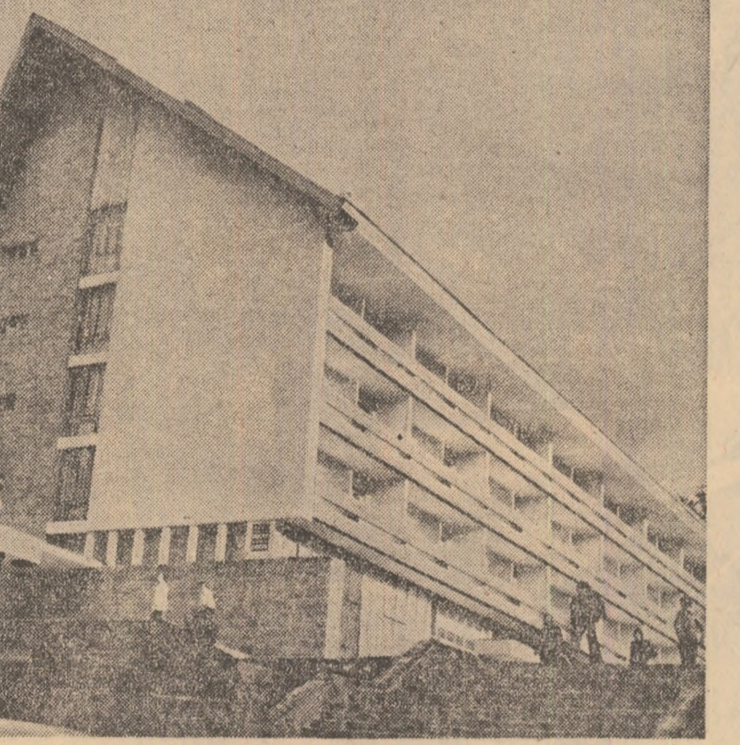
O invitație la hotelul Ciucas-Tugan.

LA TG. MUREȘ: Amfiteatrele și laboratoarele studențești GATA PENTRU ÎNCEPEREA CURSURILOR Centrul universitar Tg. Mureș este astăzi gata să înceapă activitatea științifică și didactică. Într-o sală de spectacole din cadrul teatrului de operă și balet, s-a desfășurat o sesiune de lucru în care s-a discutat despre necesitățile pregătirii cadrelor de subingineri. Am primit un substațial sprijin din partea Ministerului Industriei Construc- Investiții și muncă pentru adecvarea spațiilor de învățământ necesității pregătirii cadrelor de subingineri. Am primit un substațial sprijin din partea Ministerului Industriei Construc- LA TG. MUREȘ: Amfiteatrele și laboratoarele studențești GATA PENTRU ÎNCEPEREA CURSURILOR Centrul universitar Tg. Mureș este astăzi gata să înceapă activitatea științifică și didactică. Într-o sală de spectacole din cadrul teatrului de operă și balet, s-a desfășurat o sesiune de lucru în care s-a discutat despre necesitățile pregătirii cadrelor de subingineri. Am primit un substațial sprijin din partea Ministerului Industriei Construc-