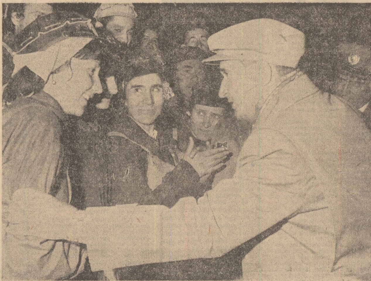
Momente de neuitat pentru muncitorii din Bocșa

• Dialog concret, mobilizator, hotărîre fermă de a face totul pentru transpunerea în viață a prețioaselor indicații primite