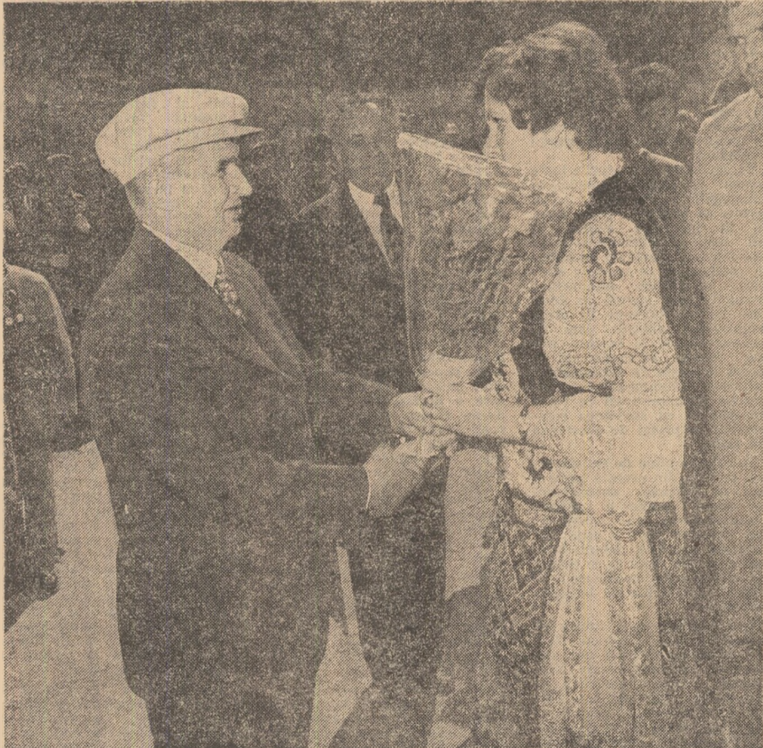
La întreprinderea mecanică din Reșița

Realizate prin aplicarea politicii științifice, clarvăzătoare a partidului nostru, toate aceste succese — rod al eforturilor (Continuare în pag. a IV-a)