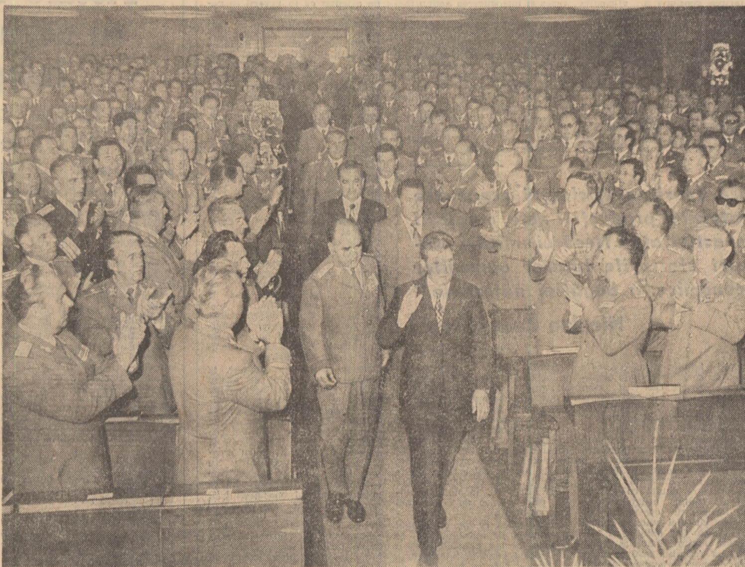
(Continuare în pag. a III-a)

Tovarășul Nicolae Ceaușescu, secretar general al Partidului Comunist Român, președintele Republicii Socialiste România, comandantul suprem al forțelor noastre armate, a participat, simbolic, la ședința activului de bază de comandă și de partid din armată. Au luat parte tovarășii Constantin Dăscălescu și Ilie Verdeț. La soare, comandantul suprem al forțelor armate a fost întâmpinat de general-colonel Ion Coșan, ministrul apărării naționale. Numeroși militari de toate gradele, aflați în fața monumentalei intrări a Academiei militare, au făcut secretarului general al partidului o caldă manifestare de stimă și prețuire. Această atmosferă însușită s-a regăsit în aula academiei, unde a avut loc ședința activului. Tovarășul Nicolae Ceaușescu a fost primit cu vibranti entuziasm, cu aplauze furtivoase și urale îndelungate. Scandind minute în șir „Ceaușescu — P.C.R.!", participanții la ședință au dat expresie dragostei înfăcșurate, dezvoltării neajmurate și respectului profund pe care toți fiii țării ce-și fac datoria sub drapelul ostirii le nutresc față de Partidul Comunist Român, față de secretarul general al partidului, comandantul suprem al forțelor armate, tovarășul Nicolae Ceaușescu. Exprimînd tovarășului Nicolae Ceaușescu adinca recunoștință și mulțumiri fierbinți ale comunistilor din armată, ale tuturor militarilor pentru participarea la lucrările activului, ministrul apărării naționale a spus: „Prezența dumneavoastră, a celorlalți tovarăși din conduce-