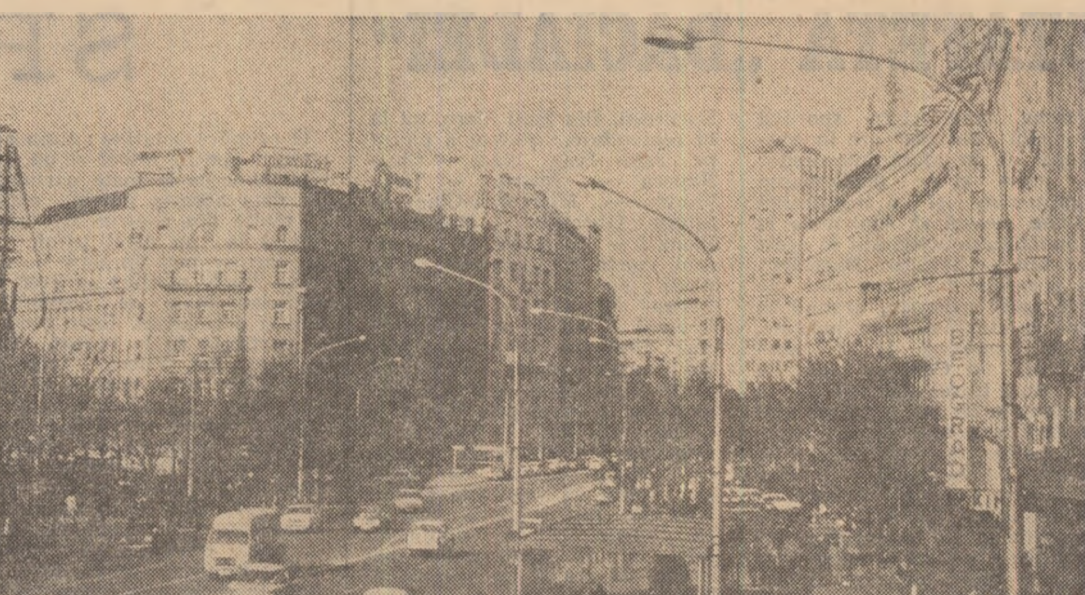
R.S.F. IUGOSLAVIA: Vedere din Belgrad, oraș aflat în continuă dezvoltare

Succedând la puțin timp în urmă sesiunii speciale consacrate exclusiv vastii problematici a dezarmării, dezbaterile vînzînd neîmportant acest subiect vor avea o pondere și mai mare decît în trecut în economia generală a dezbaterilor. Lichidarea vestigiilor colonialismului, dreptul dezvoltării, ocrotirea mediului înconjurător, combaterea rasismului și apartheidului, îmbunătățirea condițiilor femeii, copiilor și tineretului, reprimarea crimelor împotriva umanității, dreptul național, folosirea în scopuri pasnice a spațiului extraatmosferic, „nou” drept al mării, dreptul umanitar, ocrotirea și înflorirea valorilor culturale, interzicerea torturii și a tratamentelor inumane — iată doar cîteva din „esșanționalele” ce vor da substanță dezbaterilor de trei luni: ale sesiunii Adunării Generale a O.N.U. — cel mai larg for diplomatic multilateral. Fi-