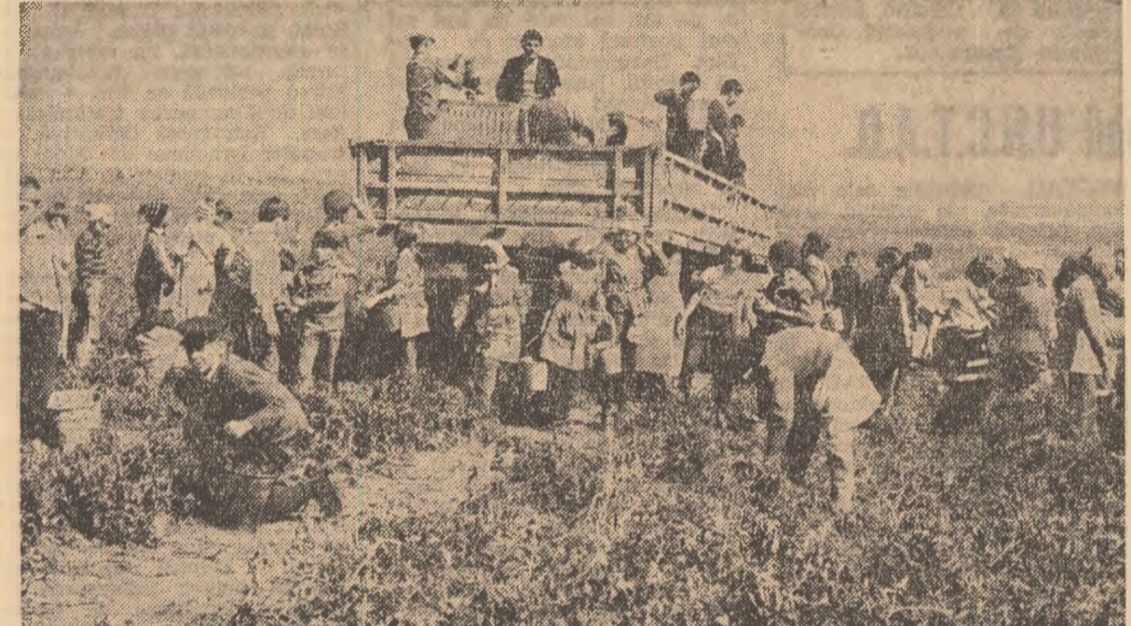
Culesul, sortatul și încărcatul tomatelor de la ferma Măriața a I.P.I.L.F. Oltenița le fac integral elevii din localitățile învecinate