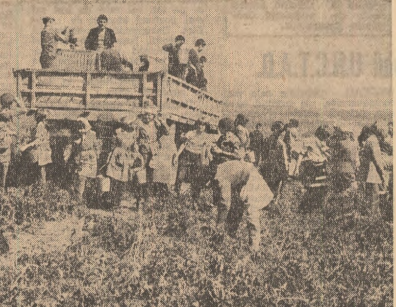
Culesul, sortatul și încărcatul tomatelor de la ferma Măriața a I.P.I.L.F. Oltenița le fac integral elevii din localitățile învecinate