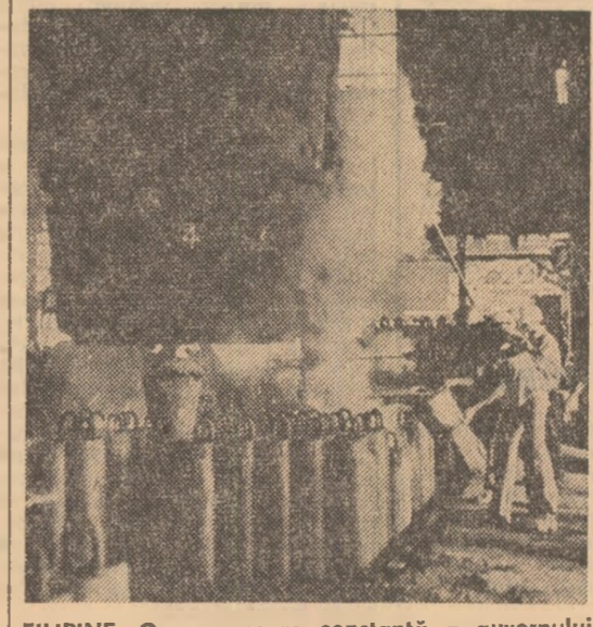
FILIPINE. O preocupare constantă a guvernului de la Manila, dezvoltarea industriei, garanție a consolidării independenței economice, a utilizării, în interes național, a bogățiilor subsolului

Conducerea Companiei naționale de electricitate din Kenya — „Kenya Power and Lighting” — a anunțat că lucrările de construcție a hidrocentralei de la Ghitura, pe fluviul Tana, se apropie de sfîrșit și, în curînd, acest obiectiv energetic va începe să furnizeze curent electric. Capacitatea centralii este de 144 MW. Pentru a apropia și mai mult nivelul capacităților energetice de necesitățile viitoare ale țării, Compania națională de electricitate proiectează realizarea a încă două centrale pe Tana. Se studiază, de asemenea, construirea unor unități producătoare de energie electrică de putere medie pe cursurile de apă ce se varsă în lacul Victoria, între care Yala și Nzola. În același timp, se pun mari speranțe în utilizarea resurselor geotermice din Valea Rift, care, potrivit studiilor, ar putea furniza energie electrică pe scară largă. Pe baza cercetărilor întreprinse, specialiștii din Kenya apreciază că resursele geotermice ale țării ar putea oferi între 170 și 400 MW. În 1970, în Kenya se prevedea accelerarea realizării programului de electrificare rurală, lansat în 1965.