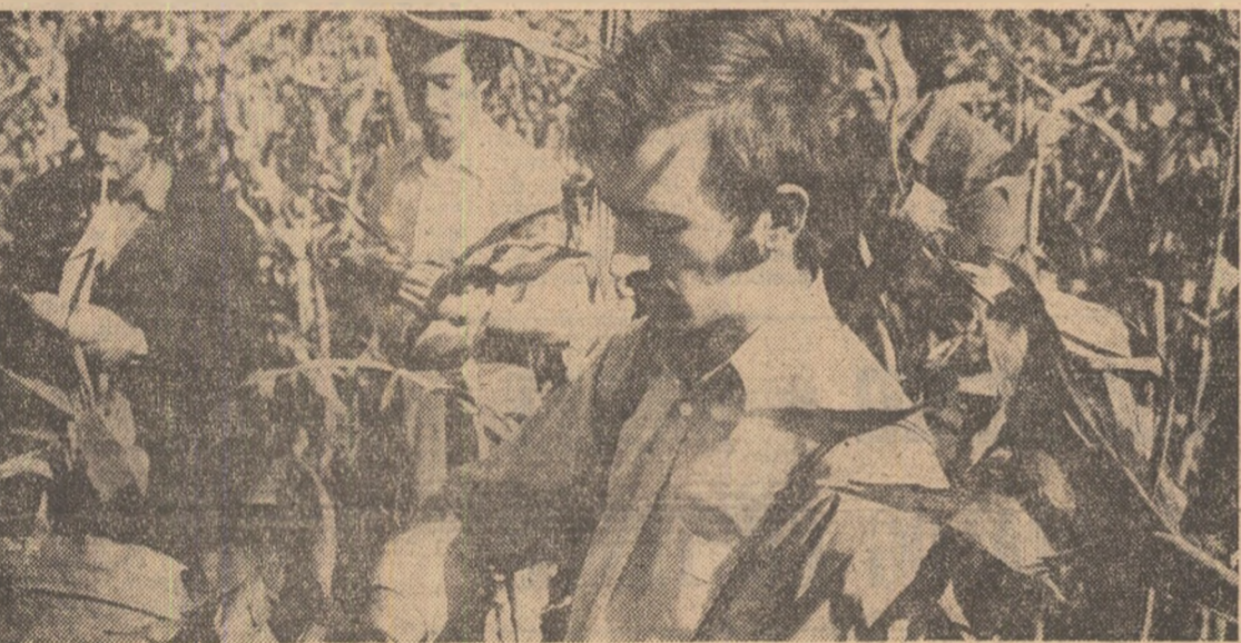
Pînă la intrarea în amfiteatrele Facultății de agronomie din București, un examen practic pe tarlalele fermei nr. 1 din Belciugatele

Indicațiile, ideile cuprinse în cuvîntarea tovarășului Nicolae Ceaușescu la deschiderea noului an de învățămînt