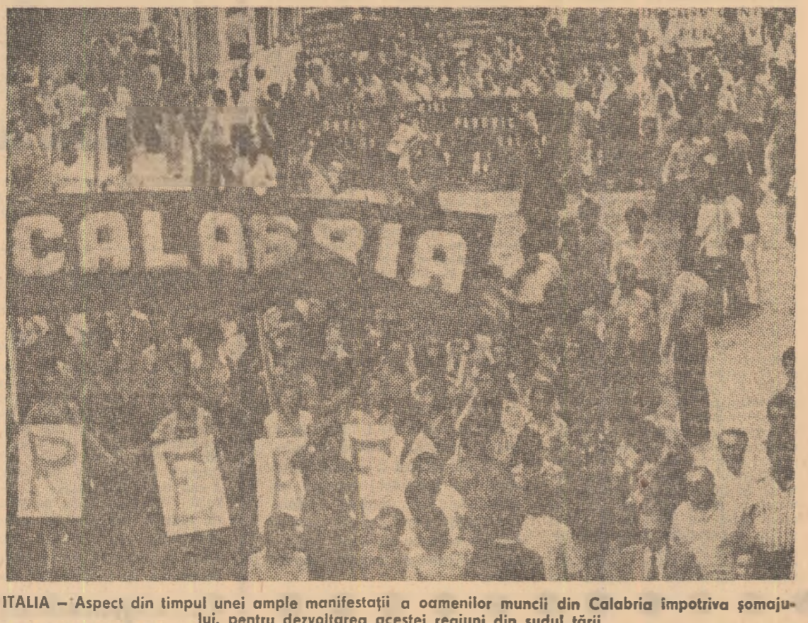
ITALIA — Aspect din timpul unei ample manifestații a oamenilor muncii din Calabria împotriva șomajului, pentru dezvoltarea acestei regiuni din sudul țării

Cuvintul secretarului general al P.C. Italian ROMA 18 (Agerpres) — La Genova, oraș cu veche tradiție muncitorească, s-a încheiat Festivalul național al ziarului „Unită”, organul central al Partidului Comunist Italian. În cele peste două săptămâni care au durat festivalul (2-17 septembrie), au fost organizate numeroase manifestări de caracter politic, cultural și sportiv. Cu prilejul încheierii festivalului, a luat cuvântul Enrico Berlinguer, secretar general al P.C.I., care a prezentat rezoluțiile și recomandările adoptate de către comitetul organizatorilor. În cadrul festivalului au fost discutate probleme deosebite care s-au pus în discuție în cadrul sesiunii anterioare, precum și probleme deosebite care s-au pus în discuție în cadrul sesiunii anterioare.