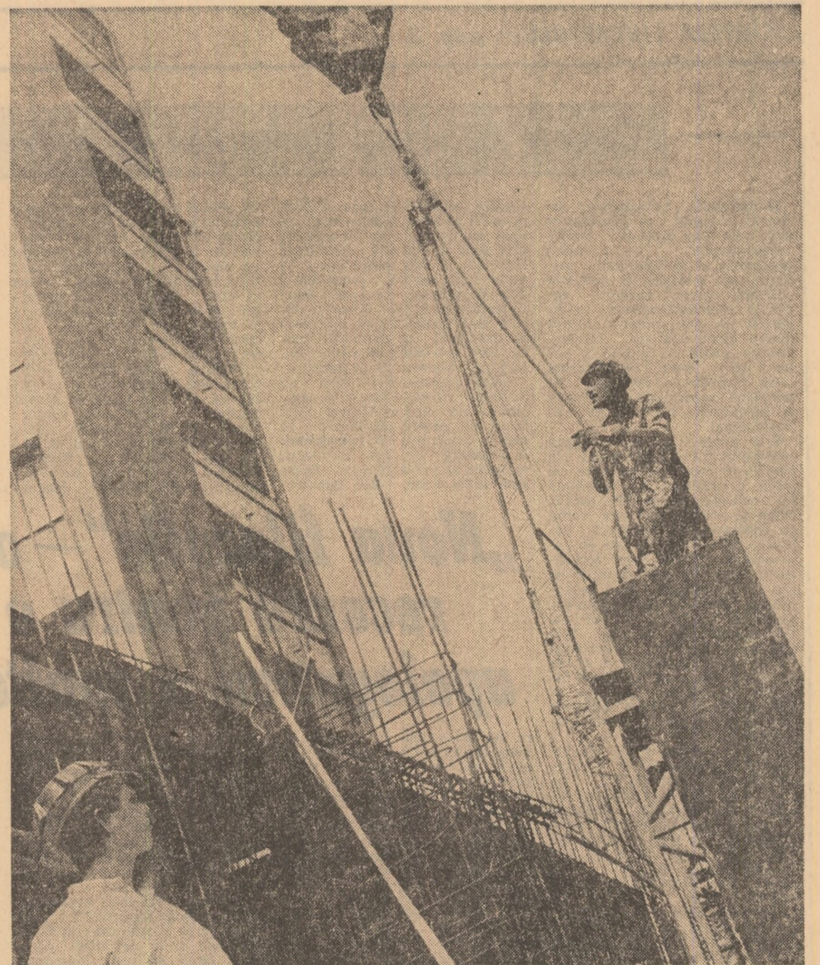
Cartierul bucureștean „Berceni” se îmbogățește cu noi și moderne edificii sociale Foto: GHEORGHE CUCU

Recoltatul la floarea-soarelui continuă în ritm intens la C.A.P. „9 Mai” din județul Teleorman Foto: GHEORGHE CUCU