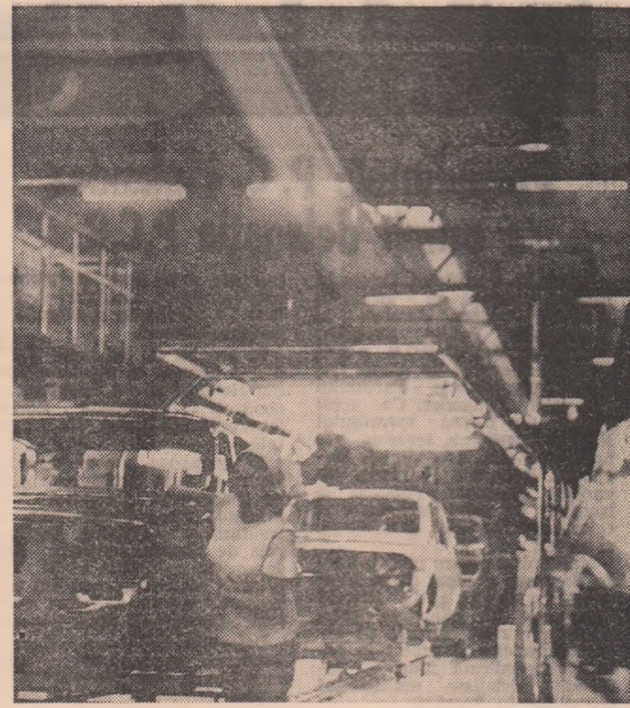
Un nou lot de autoturisme „Dacia” pe banda de finisaj