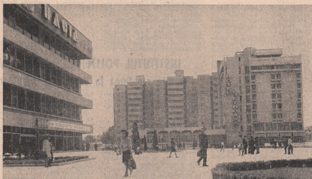
Buzău — arhitectură și confort

În sprijinul propagandiștilor și tinerilor care participă la învățămîntul politic U.T.C. • ÎNTĂRIRIA AUTOCONDUCTERII MUNCITOREȘTI ȘI AUTOGESTIUNII ECONOMICO-FINANCIARE, cerință obiectivă a dezvoltării și perfecționării relațiilor de producție socialiste, a adîncirii democratismului economic • PERFECȚIONAREA INDICATORILOR ECONOMICO-FINANCIARI AI PRODUCȚIEI, PARTICIPAREA OAMENILOR MUNCII LA BENEFICIILE condiții esențiale pentru asigurarea unei eficiențe economice superioare