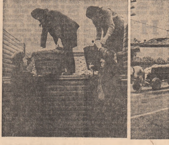
Se tîncăru și pe ploie, dar mai ales acum, pentru a nu pericula recolta la C.A.P. „30 Decembrie”. Din păcate doar 4 oameni la un autocamion, într-un ritm foarte scăzut...

„în vreme ce la Tîrșești, cărutele din cîmp spre pătule au făcut o „halță” de circa 30-40 minute la dușul „Zorului rece”. Se pierd în minute prețioase din drumul recoltei spre hambare.