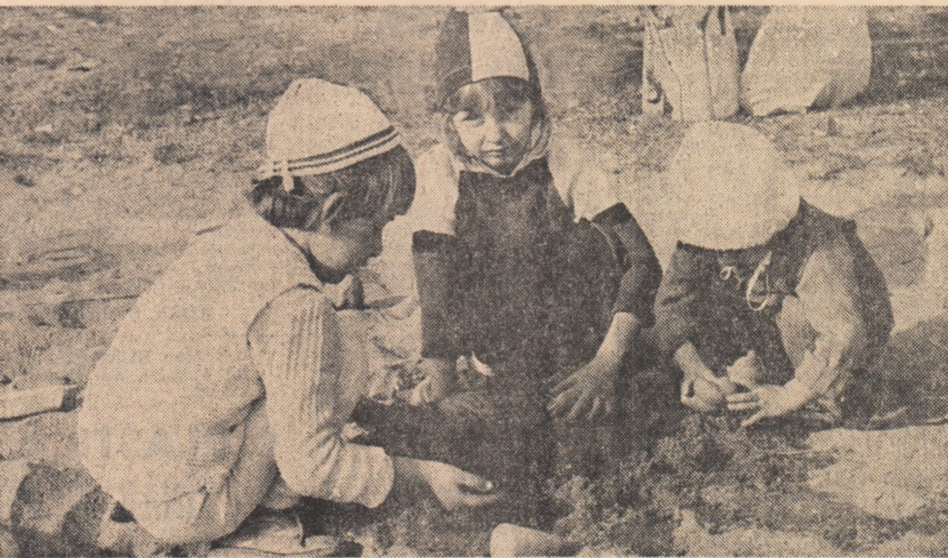
Sub razele de soare tot mai rare ale acestui sfîrșit de octombrie