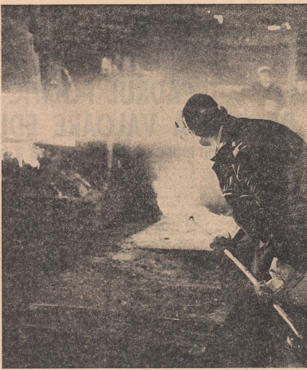
O nouă șarjă elaborată în cuptoarele turnătoriei întreprinderii „23 August” — București

mentatia necesară pentru atacarea principalelor obiective. Acum cînd avem aceste proiecte deosebite de forță de muncă. Constructorul a luat măsuri și în ultimele zile au sosit ceva oameni, zilnic trimitem și noi, beneficiarul, 70-75 de muncitori pentru efectuarea lucrărilor cu ne necesită un grad prea ridicat de calificare, respectiv săpături, betonări, închideri de hale”.