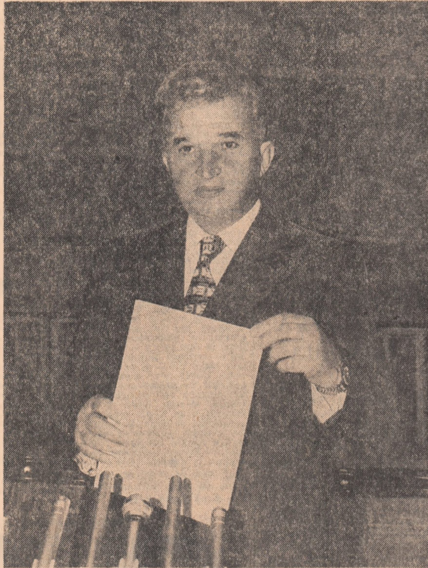
Tovarășul Nicolae Ceaușescu rostind cuvântul de încheiere a lucrărilor Plenarei Comitetului Central al Partidului Comunist Român

Miercuri, 1 noiembrie, sub președinția tovarășului Nicolae Ceaușescu, secretar general al Partidului Comunist Român, s-au desfășurat lucrările Plenarei Comitetului Central al Partidului Comunist Român.