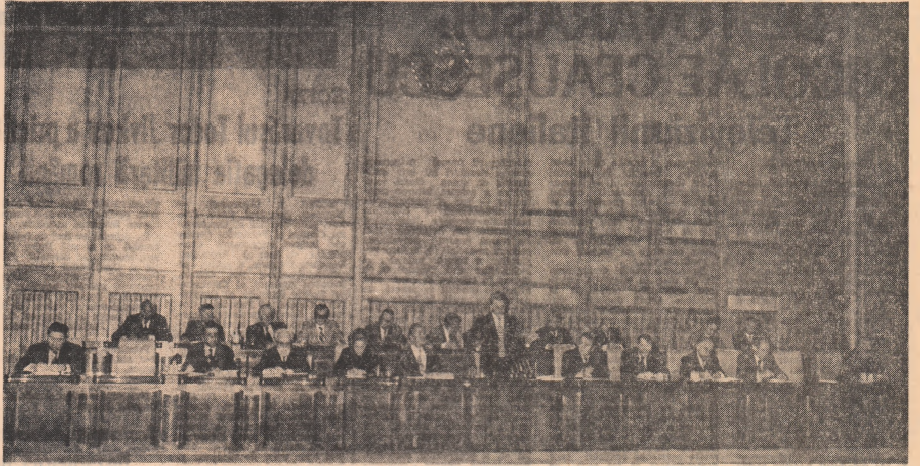
Prezidiul lucrărilor ședinței plene a Comitetului Central al Partidului Comunist Român

O importanță deosebită — a subliniat tovarășul Nicolae Ceaușescu — are clarificarea tuturor acestor probleme cu masa largă a celor ce muncesc, educarea tuturor oamenilor muncii în spiritul respectării riguroase a normelor de consum, a regulilor de folosire rațională a mijloacelor materiale ale economiei noastre, dezvoltarea unei înalte conștiințe în vederea desfășurării unei lupte neîntrerupte pentru reducerea continuă a consumului de materii prime, materiale și energie, pentru intensificarea eforturilor în vederea realizării cu mijloace mai mici a unor rezultate economice superioare. Numai astfel — a arătat secretarul general al partidului — vom putea asigura îndeplinirea istoricelor hotărâri ale Congresului al XI-lea, a Programului partidului de dezvoltare economică-socială a patriei, de creștere cit mai rapidă a României de la stadiul de țară în curs de dezvoltare la acela de țară cu o dezvoltare economică medie, numai astfel vom putea asigura obiectivul fâuririi societății socialiste multilateral dezvoltate în România, sporierea continuă a bunăstării poporului, întărirea continuă a patriei, a suveranității și independenței ei naționale.