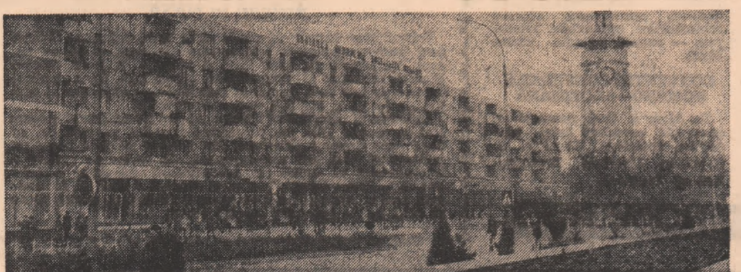
Centrul orașului Giurgiu