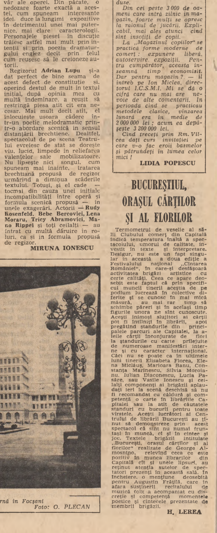
Arhitectură modernă în Focșani.