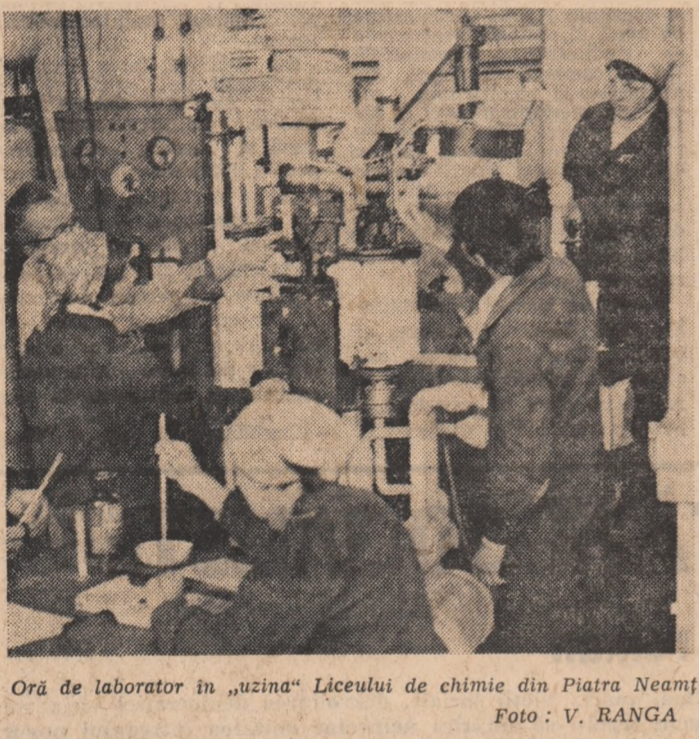
Oră de laborator în „uzina” Liceului de chimie din Piatra Neamț.