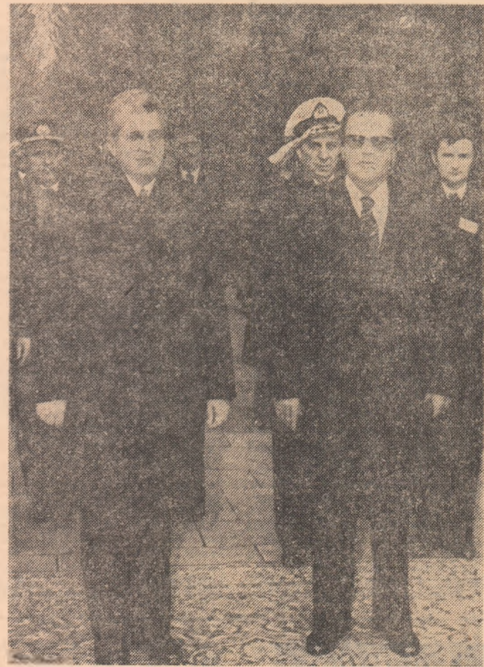
Întîlnire oficială la Palatul Alb

Tovarășul Nicolae Ceaușescu, secretar general al Partidului Comunist Român, președintele Republicii Socialiste România, a fost întîmpinat, cu deosebire căldură de tovarășul Iosip Broz Tito, președintele Republicii So-