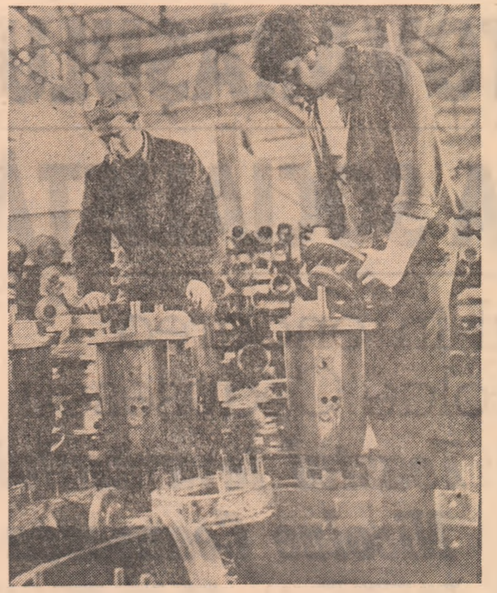
In secția de montaj a întreprinderii de pompe „Aversa”