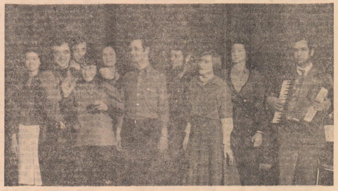
Brigada artistică a întreprinderii de confecții și tricotaje București, în timpul unei repetiții

La Liceul pedagogic din Deva s-a desfășurat faza municipală a festivalului, la care au participat 16 formații de montaj literar-muzical și 32 de recitatori din ciclul primar și gimnazial. În cadrul unei întîlniri a pionierilor din Drobeta Turnu Severin cu muncitorii frunți, a fost prezentat spectacolul de muzică și poezie „Mulțumim din inimă partidului”. Purttătorii cravatorilor roșii cu tricolor de la casele pionierilor din Adjud și Panicu, ca de altfel și colegii lor din comuna Greaca (Ilfov) și-au intitulat spectacolele de muzică și poezie patriotice: „Patrie, te cîntă pionierii”. Elevii Școlii generale nr. 23 din Iași, din comuna Vocotesti, Lungani și Voinești deducă acțiunile lor artistice aniversării a 2050 de ani de la crearea primului stat dac centralizat și a 60 de ani de la unificarea statului național român. Ardeleanii închină manifestările culturale-artistice împlinirii a 2000 de ani de la întemeierea cetății din „Atridava” și a 850 de ani de astersare documentară a municipiului lor. (Emilia Vasiliu).