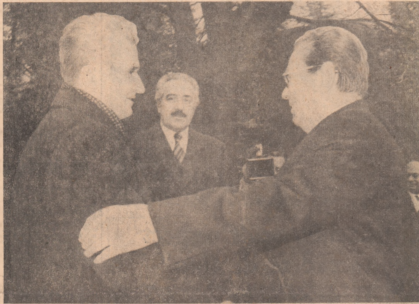
La Palatul Alb de pe Dedinie, tovarășii Nicolae Ceaușescu și Iosip Broz Tito își strâng miinile cu căldură, se îmbrățișează cu prietenie

Înaltul sol al poporului român întâmpinat sărbătorește la Belgrad