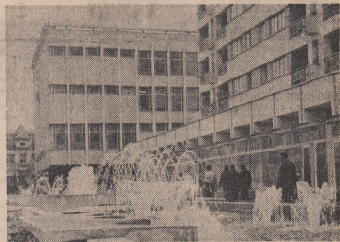
Noi construcții în Tg. Jiu

● Să barăm cu hotărâre căile risipei, să întărim spiritul gospodăresc! Specialiștii ne demonstrează: Activitatea comercială — la aceiași parametri calitativi PRINTR-UN CONSUM REDUS DE ENERGIE ● Cronică literară: COMENTARIILE DESPRE CLASICI ● Cetățenești: DESPRE JUCĂRII, LA MODUL SERIOS ● ARĂTURILE DE TOAMNĂ — CIT MAI REPEDE ÎNCHIEIATE! (relatări de pe ogoarele județelor Caraș-Severin și Brăila)