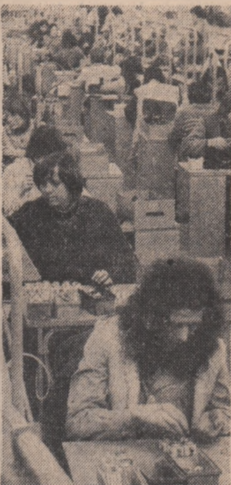
La întreprinderea de izolatoari electrice preșaji de joasă tensiune din Tg. Secuiesc

În sectoarele de concepție ale unităților de profil de la Mizil, Neohiu, Tirgoviște, Cimpina, Ploiești și Rm. Sărat s-au realizat anul acesta 90 de produse și modele noi de mobilă, o bună parte dintre ele tipuri de mobilă stil și tapisată. Paralel, specialiștii unităților amintite și-au îndreptat atenția asupra reducerii consumurilor, reușind ca, pe această cale, să economisească o cantitate de masă lemnoasă și alte materiale din care se pot realiza aproape 8 000 fotolii.