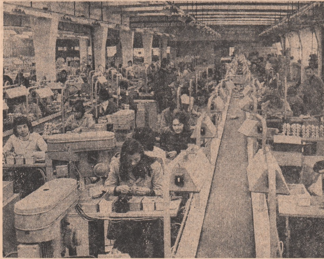
Tineretea și hărnicia și-au dat mina în noua și modernă Întreprindere de izolatoari electrice de joasă tensiune din Tg. Secuiesc