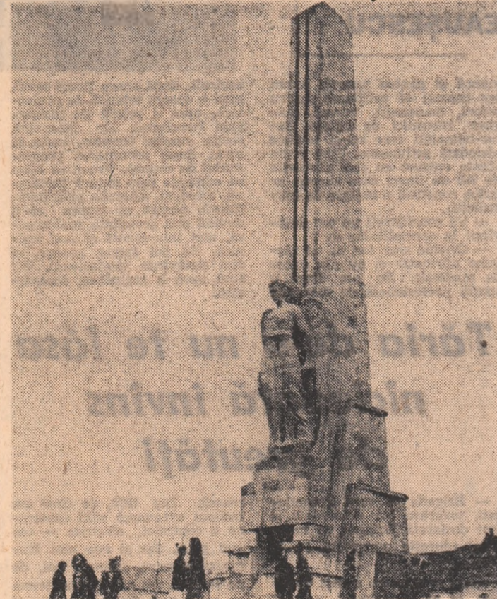
Torneul orchestrei Radioteleviziunii Române

● FRUMUSEȚILE NATURALE ALE BRĂȘOVULUI și ale împrejurimilor, zapada căzută din belșug în ultimele zile au atras și la acest sfîrșit de săptămîină mii de turiști. Complexele carpatine — moderne ho-