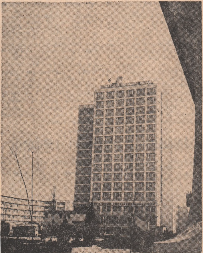
Sibiu, pe noile coordonate ale arhitecturii

În numele oamenilor muncii din ramura construcțiilor de mașini, — se spune în încheierea telegramei — vă asigurăm pe dumneavoastră, iubite tovarășe Nicolae Ceaușescu, că vom face totul pentru înlăturarea neabătută a politicii partidului nostru, ne vom consacra în continuare totala putere de muncă și creație pentru transpunerea în practică a hotărîrilor Congresului al XI-lea și ale Conferinței Naționale.