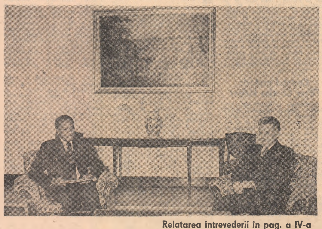
Relatarea întrevederii în pag. a IV-a