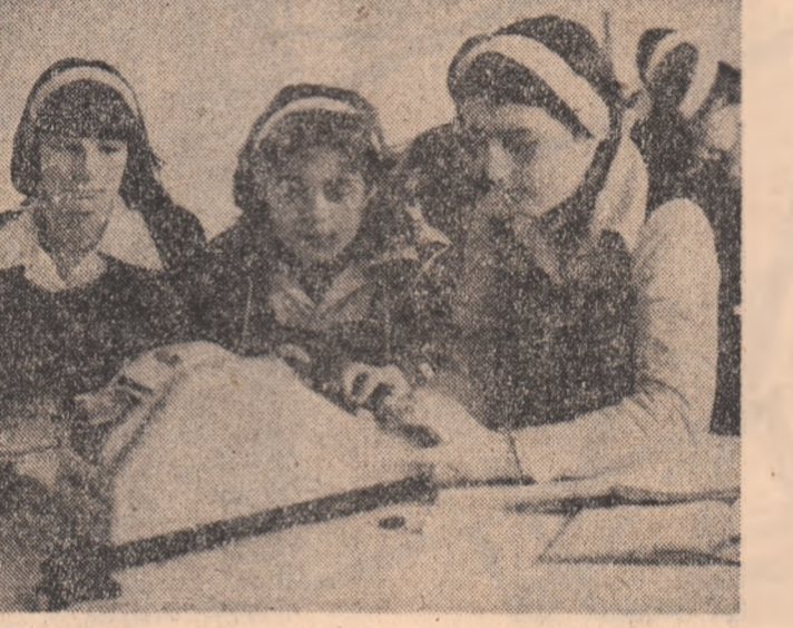
Oră de matematică în cabineta de specialitate de la Liceul „Horea, Cloșca și Crișan” din Alba Iulia.

*) EDMOND NICOLAU: Om — mașină — cibernetică, Editura politică, 1978.