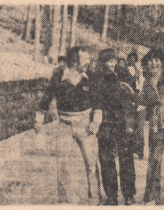
Avanpremieră la vacanța studențească. Studenți agronomi bucureșteni spre cabanele din Bucegi