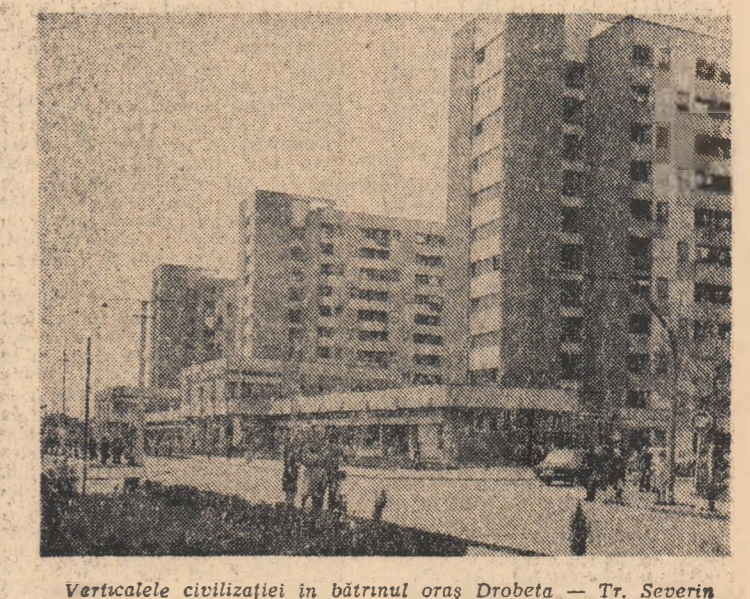
Verticalele civilizației în bătrînul oraș Drobeta — Tr. Severin.