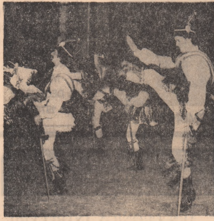
Dans din Transilvania

adevărul ei. La fel cum, în aceștia termenii, viziunea fatalistă, după care evenimentele din viața omului sînt dinainte determinate de o forță implacabilă pe care omul nu o înțelege și în fața căreia rămîne nepotencios este de-a dreptul falsă. A nega astăzi rolul activității conștiente, transformatoare a omului, a și-l imagina ca o unealtă în milinea necesității oarbe, recomandîndu-i resemnare și pasivitate înseamnă pur și simplu a refuza adevărurile științifice.