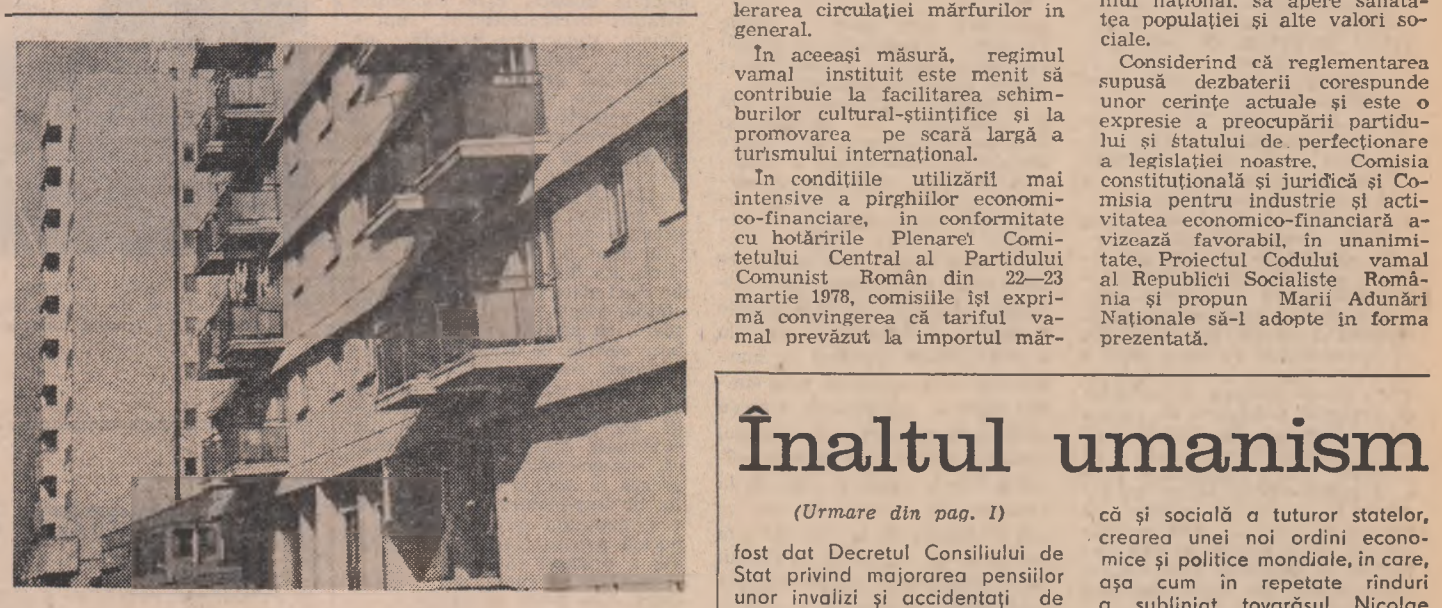
Din noua arhitectură a Buzăului.

Comisia constituțională și juridică și Comisia pentru industrie și activitatea economică-financiară ale Marii Adunări Naționale, întrunită în ședință de lucru, au analizat și dezbătut, în cadrul competenței lor, proiectul Codului vamal. Cu prilejul dezbaterii în comisie a rezultat că acest proiect este deosebit de important și necesită de sistemizare a reglementărilor vamale, într-un cadru unitar, la nivel de Cod, astfel încât să se elimine orice paralelisme și să se faciliteze activitatea organelor de aplicare în acest domeniu.