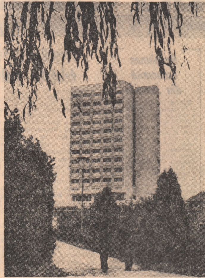
Noul hotel din Alba Iulia.

menților aniversate și lupta populară conștientă sub conducerea Partidului Congolez al Muncii.