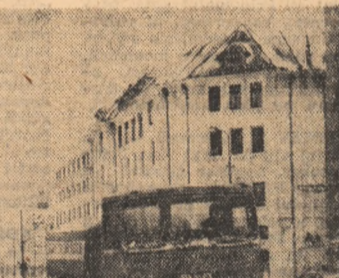
Ieri, pe principalele artere ale Capitalei s-a intervenit operativ la curățatul zăpezii.