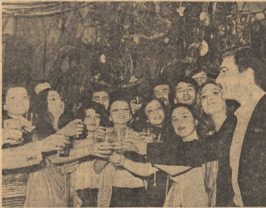
La mulți ani!

Ca în fiecare an, tinerii patriei au sărbătorit Revelionul împreună, cu bucuria marilor izbînzuri ale muncii creatoare pentru țară, cu încredere deplină în viitorul de pace, bunăstare și fericire al poporului nostru. Ca în fiecare an, la cumpăna leierică a acestui ceas de bilanț, tinerii muncitori, țărani, intelectuali — români, maghiari, germani și de alte naționalități — au trăit împreună clipele de entuziasm și bucurie ce rostuesc un nou avînt muncii noastre și sensului de devenire al istoriei; au ținut să fie împreună și în această clipă în care anii își dau mina peste creșterile noastre într-o dialectică a devenirii care marchează cu o luminoasă cadență fiecare pas către mine. Un mine care stă în puterea noastră de astăzi și în cantitatea de angajare pe care înțelegem s-o dăruim viitorului, în calitatea ei.