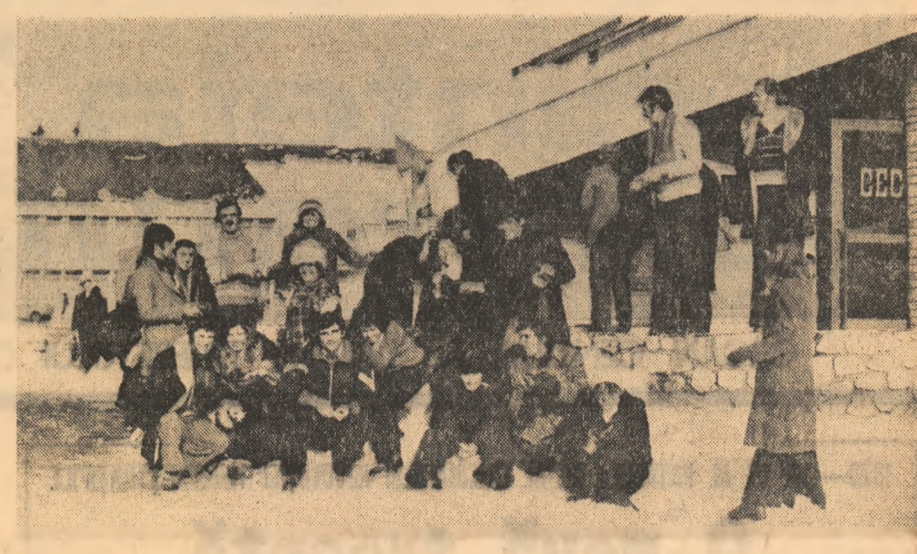
Studenți agronomi în excursie pe Valea Prahovei

Sub egida Festivalului „Cintarea României” lași s-a desfășurat în zilele acestei vacanțe de iarnă, a VII-a sesiune națională de referate și comunicări științifice a elevilor. Au fost prezentate 325 de lucrări, selecționate în juru a două sute de personalități de frunte ale științei științifice și culturale țesene, din reprezentanți ai C.C. al U.T.C., Ministerului Educației și Învățămîntului și ministrului economiei. S-au acordat 168 premii și mențiuni. Lucrările au pornit de la situații concrete, cercetările s-au desfășurat în cadrul real al muncii, rezultatele s-au materializat în aparate și dispozitive pe care elevii le-au adus la Iași, demonstrîndu-le pe viu calitățile. Să amintim cercetarea făcută în adunările minei de elevii din Petrosani, procedeele propuse de elevii din Vilcea, Prahova și Cluj pentru recuperarea metalelor și gazelor, experiențele pe loturile școlare soldate cu noi metode de creștere a productivității muncii ale celor din județele Ilfov, Iași sau Olț, complicatele aparate de laborator ale elevilor din Satu Mare. Universitarii ieșeni au fost impresionati de faptul că foarte tineri cercetători au proiectat un avion cu decolare și aterizare aer (Sibiu), linii cu perne de aer (Iasi), sisteme de stocare a energiei pe timp neîntinse (Cluj), o instalație de alimentare a deuterului (Constanța) — probleme adevărate pentru savanții lumii. De asemenea, au fost prezentate teme care abordau probleme privind dezvoltarea economică-socială a localităților țării.