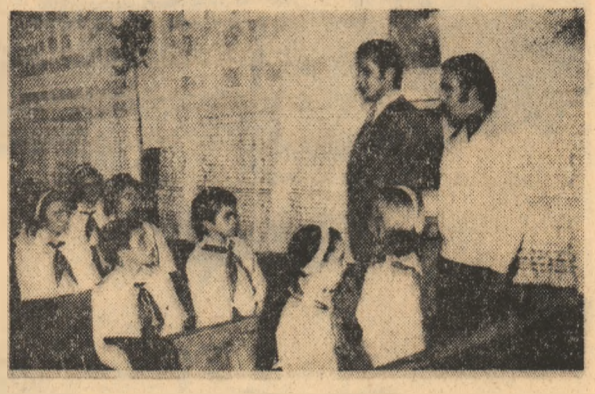
Una din cele mai pretuite inițiative ale Casei pionierilor și soimilor patriei din municipiul Hunedoara este organizarea, în aproape toate școlile, a unor întâlniri cu oameni ai muncii din întreprinderile hunedorene pe tema alegerii viitoare profesii. Imaginea reprezintă un moment al unei astfel de întâlniri, desfășurate la Școala generală nr. 11 din localitate, în scopul educării prin muncă, pentru muncă, a celor mai tinere generații de elevi.