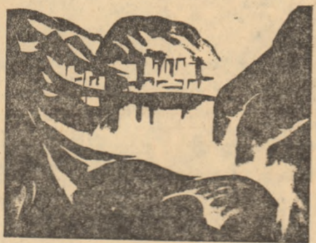
Iulia Hălăuceanu: „SPRE ORAS”