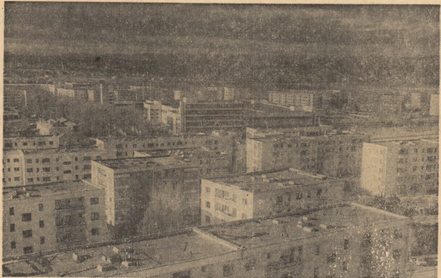
Noi blocuri de locuințe în municipiul Suceava