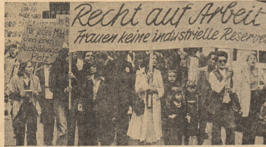
R.F. GERMANIA. Aspect de la o demonstrație a femeilor din orașul Mainz, pentru asigurarea dreptului la muncă