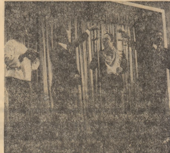
Pe scenă, brigada artistică a întreprinderii „Semănătoarea” din Capitală