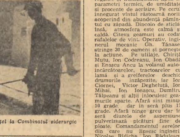
Probă pentru o viitoare gară de oțel la Combinatul siderurgic Galați

La Șantierul naval din Galați a avut loc ieri inițiativa premieră a acestui an: lansarea unei drăgi de 3.500 mc/h. Aceasta drăgă face parte dintr-o serie de 10 bucăți care vor fi lansate în cursul acestui an la Galați.