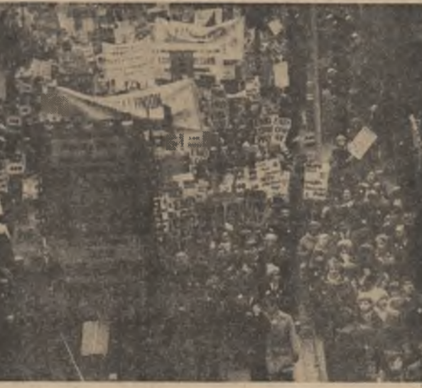
MAREA BRITANIE — Demonstrația la Londra a oamenilor muncii din serviciile publice, organizată împotriva politicii guvernului în domeniul salariilor și al contractelor de muncă

De la „Waterloo” încoace (e vorba, firește, de glăgăruț lansat de grupul muzical suedez și nu de ultima bătălie a lui Napoleon), ABBA merge din succes în succes.