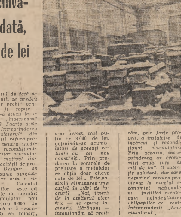
zăm, prin forțe proprii, o instalație de încălzit și reconstrucționat acumulatorii. Prin această întreprindere a economit anual sute de mii de lei.

s-ar investi mai puțin de 3000 de lei, obținându-se acumulatori de aceeași calitate cu cei nou construiți.