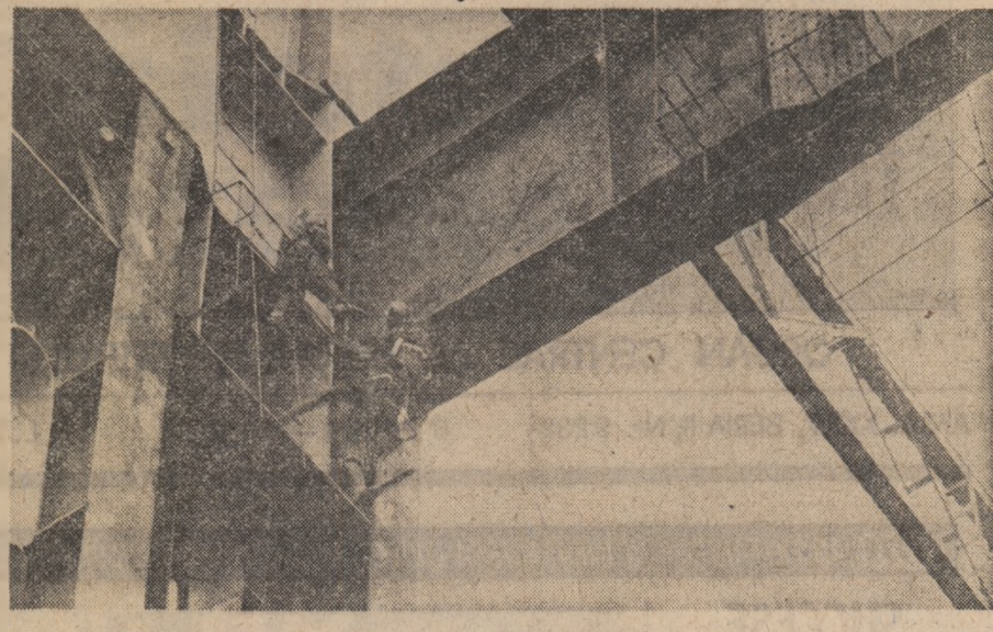
O viitoare capacitate de producție capătă contur