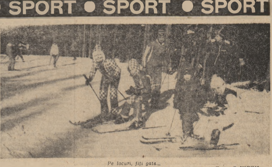
Pe locuri, fiți gata...

Duminică s-au desfășurat în județul Hunedoara ample manifestări culturale-artistice organizate în cadrul Jazei Județene a Festivalului Național „Cântarea României“... Manifestările au avut loc în satele din județ și au fost organizate de comitetele locale ale Uniunii Tineretului Comunist.