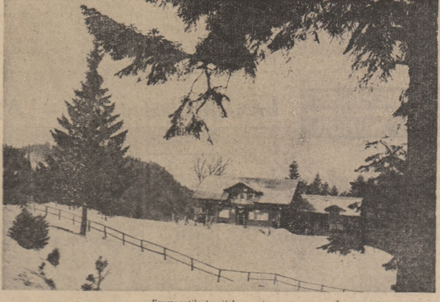
Frumusețile iernii la munte