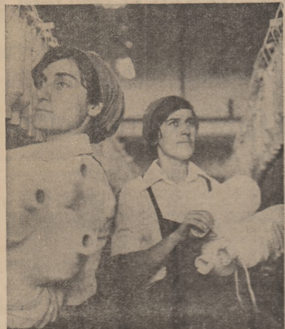
„Aurul alb” al muncii tinereților de la Întreprinderea textilă din Slatina.

Lucrătorii unităților cu activitate continuă din județele Prahova și Dimbovită își sporesc continuu realizările. Cu succese din ultima duminică a lunii, cînd agregatele au funcționat la parametri superiori, ei au ridicat la 25 milioane lei valoarea producției fizice suplimentare obținute de la începutul anului, furnizînd în plus economiei naționale importante cantități de fier și hidrocarburi, produse chimice, cărbune, oțel și laminale, ciment, prefabricate, cherestea și alte produse.