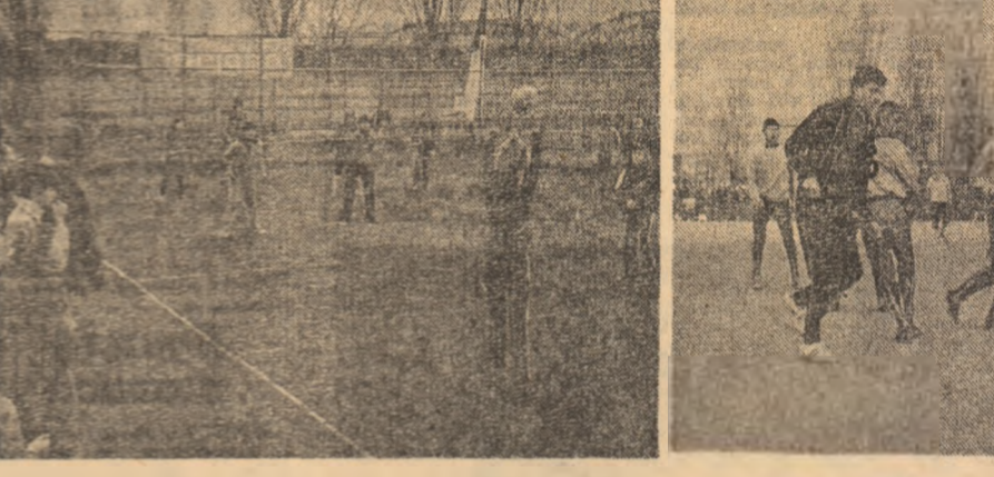
Marele turneu internațional de box „Centura de aur” în Sala polivalentă din Capitală