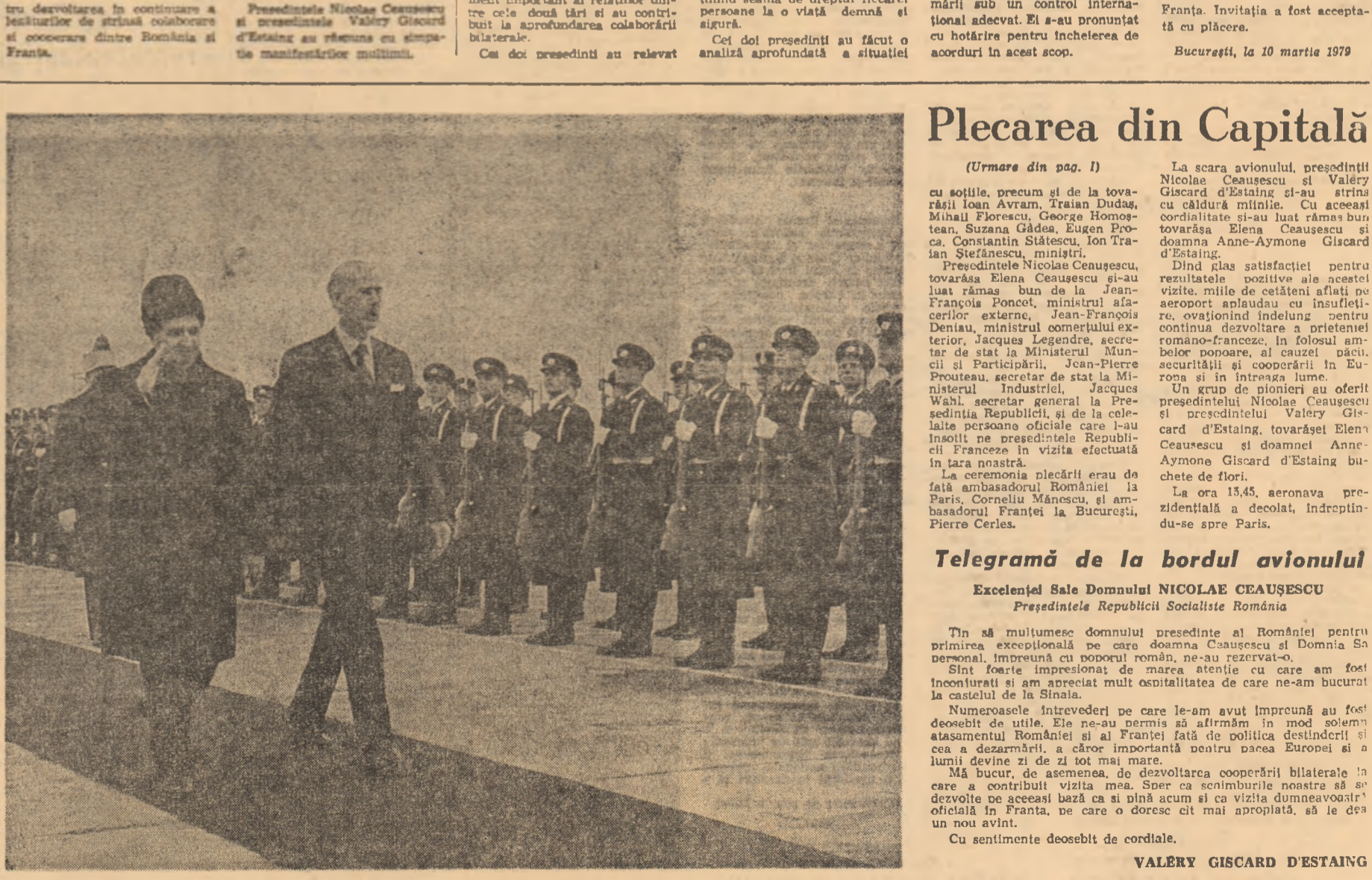
VALÉRY GISCARD D'ESTAING

Documentele au fost semnate din partea română de Cornel Burtică, viceprim-ministru al guvernului, ministrul comerțului exterior și cooperării economice internaționale, iar din partea franceză — de Jean-François Deniau, ministrul comerțului exterior.