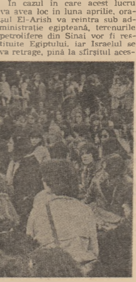
ITALIA. Manifestație a studenților din Roma împotriva șomajului și recrudescenței violenței

TEL AVIV. — Miercuri, guvernul israelian a aprobat ultimele două propuneri adresate Israelului și Egiptului de către S.U.A. în legătură cu realizarea unui tratat de pace egipteano-israelian. Potrivit unui anunț oficial din Tel Aviv, guvernul israelian urmează să se pronunțe definitiv asupra ansamblului tratatului.