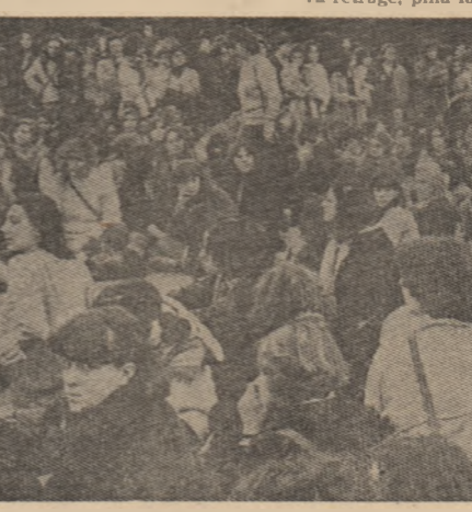
ITALIA. Manifestație a studenților din Roma împotriva șomajului și recrudescenței violenței