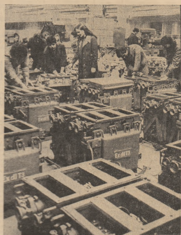
În loc de concluzii am consemnat angajamentul deosebit al tinerilor din cadrul unității de producție...