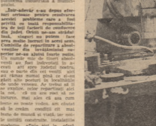
Întotdeauna spunem, un tânăr colectiv de muncă se dezvoltă în jurul unui nucleu de oameni bine pregătiți profesional...