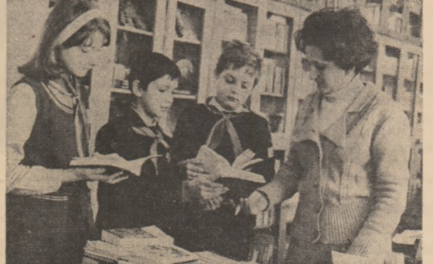
Aflați într-una din recreații, elevii Liceului „Al. I. Cuza” din Focșani vin la bibliotecă.

DUȘUL REȚE DE LA TROPICE După cucerirea ședere de câteva zile la maternitățile tinăra mamă, cu adrasa ei, pleacă măr de departe. „Milionarul” le tu duce cu autobuzul, cale de câteva zile, în localitatea sa de baștină, Piraicocoba. Peisajul fermecător, cu vegetație luxuriantă, cu sălbătăchici și coruri de pasări, cu râuri limpezi și vijeltoase pe care le treceau ar fi trebuit să-i incinte privirea și sufletul, dar fata din orașul transilvănean, răătăcită dintr-o eroare pe alte meridiane, n-avea ochi pentru frumusețea naturii. Oricât de tulburătoare ar fi fost pentru ea, erau străine, nici pasările în culorii vii nu cîntau pentru ea, nici cocotierii cu nucile cit dovleci nostri nu rodeau pentru ea, ba nici măcar Zilmo Telles de Freitas, sau cum l-a chemat în realitate, nu mai însemna mai nimic pentru Sanda. — Cum se purta el, în acest timp, cu dumneavoastră ? — Din ce în ce mai rece, mai rezervat, ceea ce mă făcea să