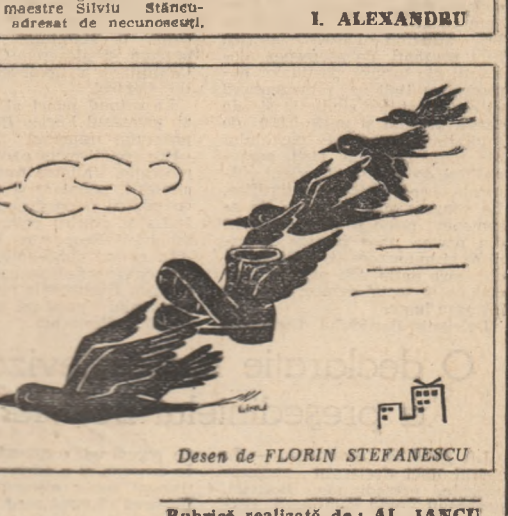
Desen de FLORIN ȘTEFANESCU