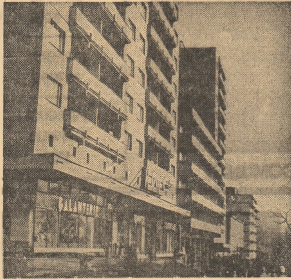
Din noua arhitectură a Petrosani.