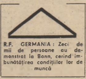
R.F. GERMANIA: Zeci de mii de persoane cu demonstrat la Bonn, cerind îmbunătățirea condițiilor lor de muncă

RABAT — Într-o cuvintare rostită în Comisia parlamentară pentru afaceri externe a Marocului, ministrul de externe Mohamed Bouccetta a subliniat necesitatea unei reglementări globale a crizei din Orientul Mijlociu.