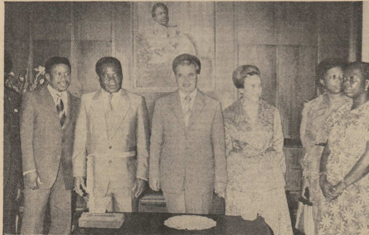
Ceremonia înmînării cheii orașului Libreville

ÎNSCRIINDU-SE CA UN MOMENT IMPORTANT ÎN ISTORIA RELATIILOR ROMÂNOLIBIENE, BAZATE PE STIMĂ ȘI PRIETENIE, REAFIRMÎND HOTĂRIREA DE A DEZVOLTA ȘI ADÎNCI COOPERAREA PE MULTIPLE PLANURI, ÎN INTERESUL RECIPROC, AL PĂCII ȘI COLABORĂRII INTERNAȚIONALE, S-A ÎNCHEIAT