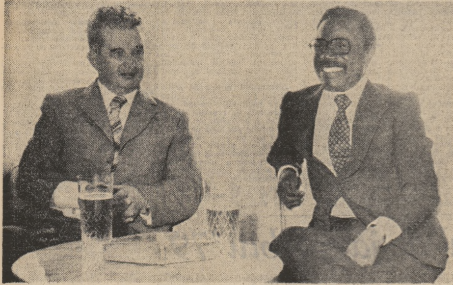
Președintele Republicii Socialiste România, tovarășul Nicolae Ceaușescu s-a întâlnit luni după-amiază la palatul prezidențial „Renovation” din Libreville, cu președintele Republicii Gaboneze Omar Bongo.

În cadrul întrevederii, cei doi președinți au acordat o deosebită atenție examinării stadiului relațiilor bilaterale pe diverse planuri. Ei au constatat cu satisfacție că acordurile și înțelegerea convenite cu ocazia întâlnirii de la București, din 1975, au creat o bază trainică extinderii și dezvoltării acestor relații pe tărîm politic, economic, tehnico-stiințific, cultural și în alte domenii de interes comun. De ambele părți s-a manifestat hotărârea de a da un nou impuls conlucrării bilaterale, promovării unei largi și fructuoase cooperări.