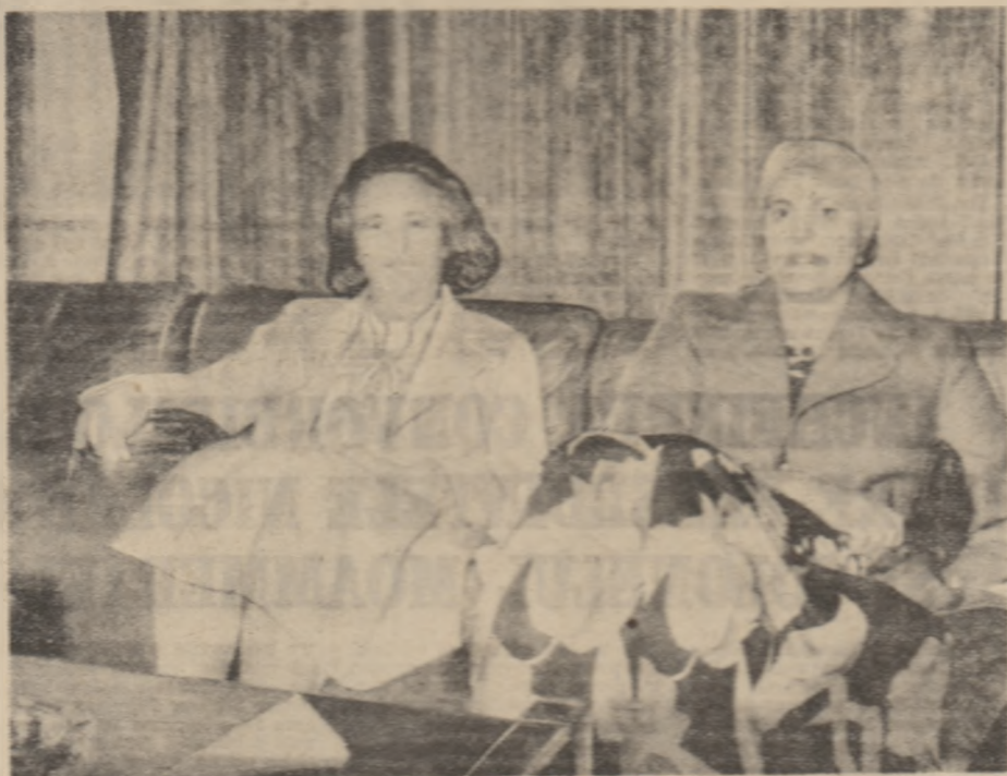
Lăsa, în Benghazi, a avut loc o nouă întâlnire cu tovarășea Elena Ceaușescu cu doamna Safia Farkash, soția conducătorului poporului libian, Moammer El Gaddafi.

Desfășurată într-o atmosferă de căldură cordială, de simț reciproc și respect reciproc, întâlnirea a