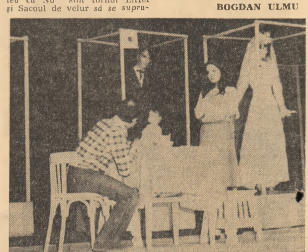
Scenă din piesa „Acesti ingeri triști” de D.R. Popescu, în interpretarea actorilor Teatrului Popular din Zalău

Joane de la spectatori: tele-foane de mulțumire de apreciere. Unii chiar doreau să revadă spectacolul. O parte din cei treizeci și cinci de mii de locuitori ai Zalăului vor asigura publicul necesar pentru cel puțin treizeci de spectacole la sediul Apoi, reprezentarea va pleca în deplasare în alte orașe: Jibou, Șimleu, Cluj-Napoca, Sibiu, Satu-Mare etc. Sase spectacole pe luna la sediul, alte două-trei în deplasare, plus repetiții paralele (s-a putut că nu sint turnul Eiffel și Sacoul de velur să se supra-