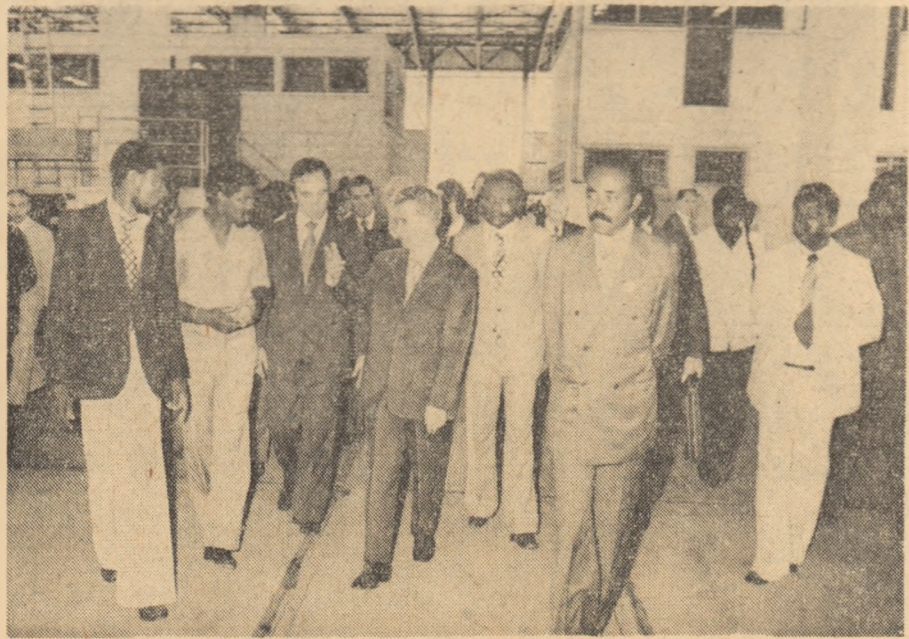
În mijlocul constructorilor magistralei feroviare „Transgabonezul”

Pe aeroport se aflau numeroase personalități ale vieții politice gaboneze: Martin Bongo, ministrul afacerilor externe și al cooperării, Edouard-Alexis Mbouy-Boutzit, ministru de stat