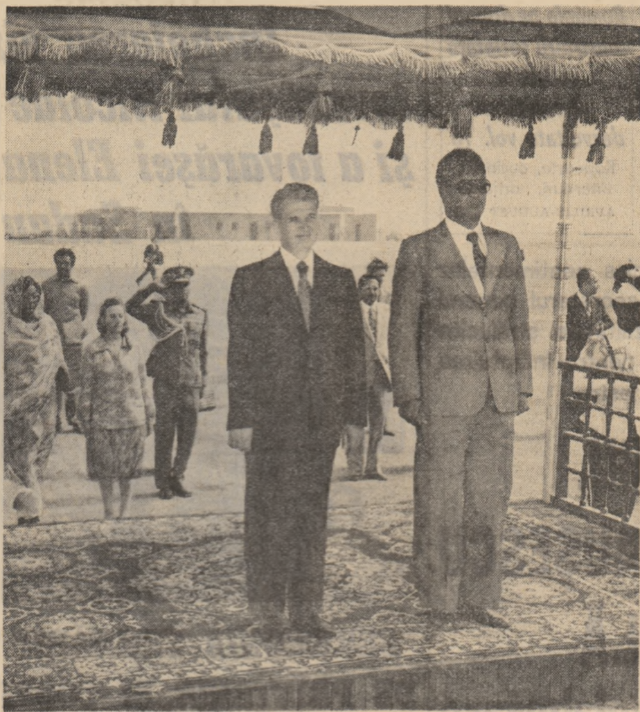
Politici al Uniunii Socialiste Suda-nene...