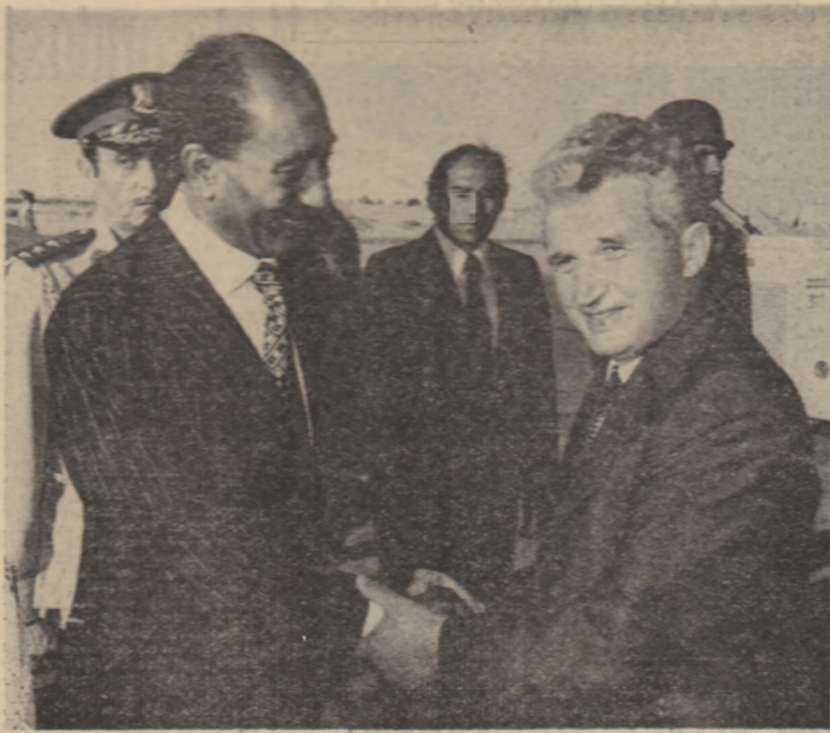
Telegramă de la bordul avionului

La ora 17.15 aeromava prezidențială a decolat, îndreptându-se spre București.