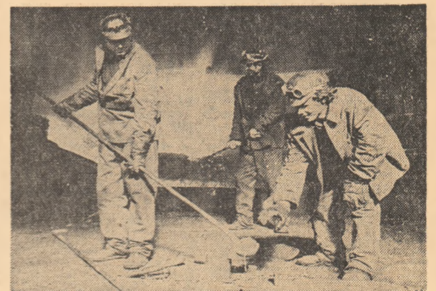
Proba oțelului — la Combinatul siderurgic Galați