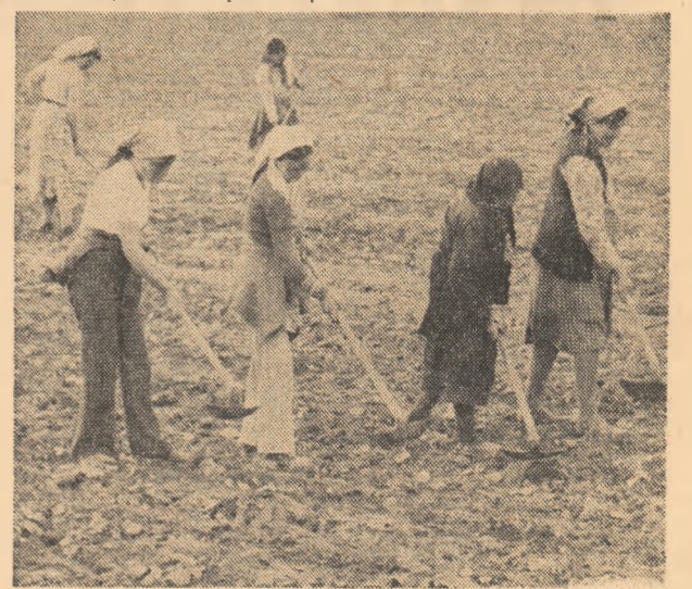
O lucrare la zi — prășitul