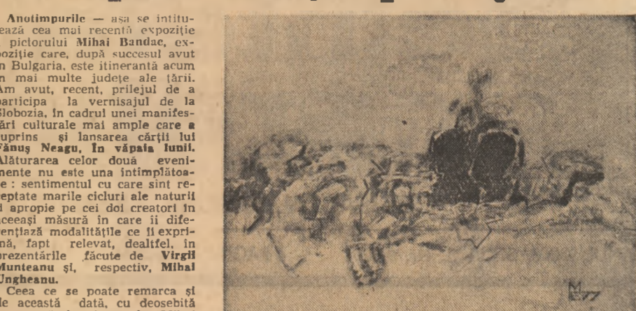
Sfirșit de august De obicei, în situații similare trecerea spre multiplicarea sau dispersia semnificației se face pe nesimțite...