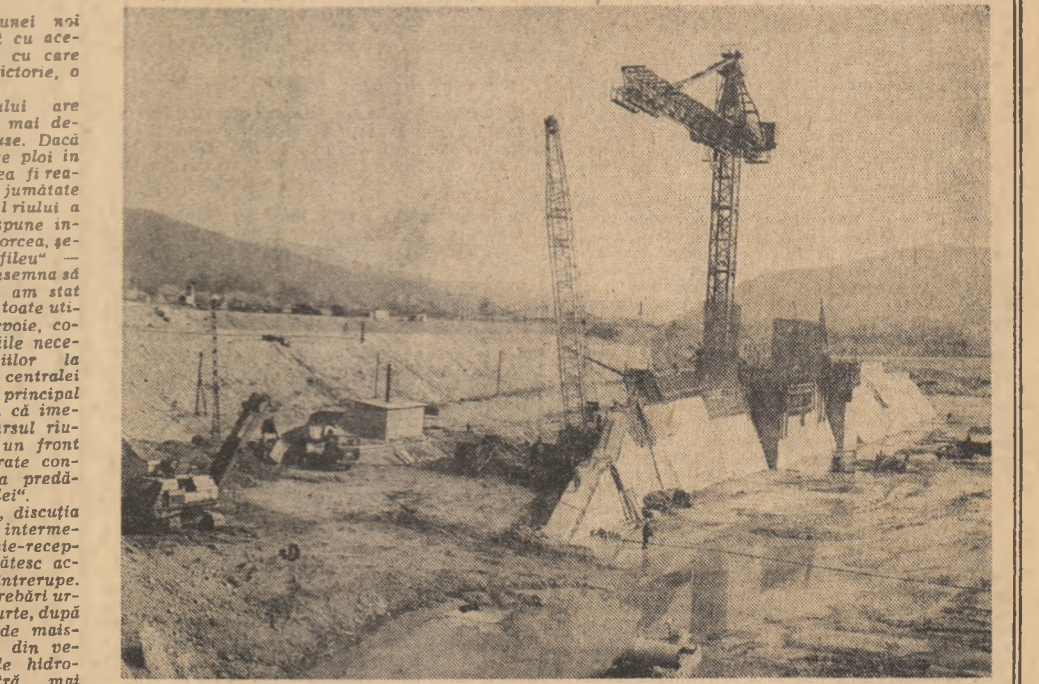
cerării, Oltul ascultă blind de oamenii care îl călduzesc pe altă albie, săpată de ei. Sau poate că este numai o impresie, de fapt, experiența oamenilor, pri-

ceperea cu care ei execută asemenea acțiuni, fiind „cheia” cu care se închid „porți” în calea guvoaielor puternice de apă. Curînd, tumultul iscat de vailurile înalte ale riului, ce pare o clipă nedumerit de noile sale