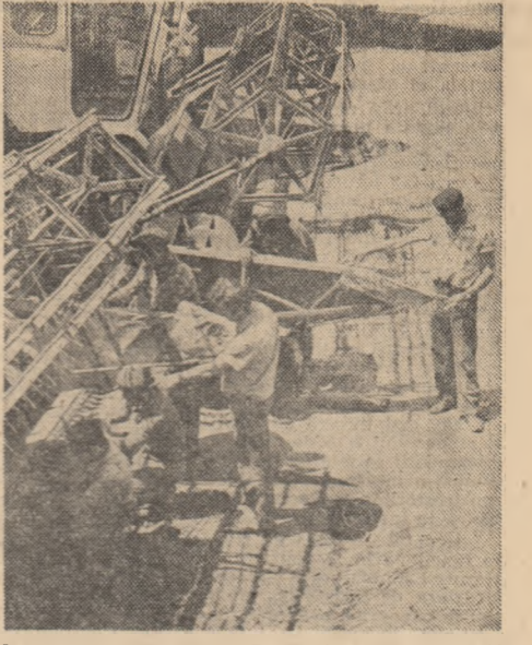
La cooperativa agricolă Gemenale 13 din cele 11 combine ale unității au fost reparate prin forțe proprii

„Pentru lucrătorii ogoarelor brălene săptămîna aceasta este perioada în care, prin angajarea susținută a forțelor mecanice și manuale în cîmp, pe toată durata zilei-lumină, vor fi finalizate toate activitățile de sezon, ce preced declanșarea campaniei de seceriș. În acest sens, comandamentul județean pentru agricultură a stabilit un program de acțiune pentru ca în următoarele 3-5 zile să se încheie a doua prășă