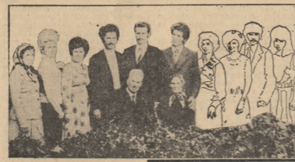
un drum al OMULUI

● La un pas de a fi slugă ● Tractorist cu viața în vagonet ● Falsa pedagogie a unor replici de director ● Nelipsita întoarcere la zădărie ● Primul pat cu ceasul alb și curat ● Pinea nu are semne, dar în ea sînt cuprinse toate drumurile omului ● Cuvinte pentru mine.