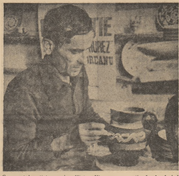
Cunoscutul artist popular Victor Vișoreanu continuă să rămîna unul dintre cei mai renumiți ceramiciști din țară