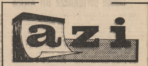
De citiva quadrati