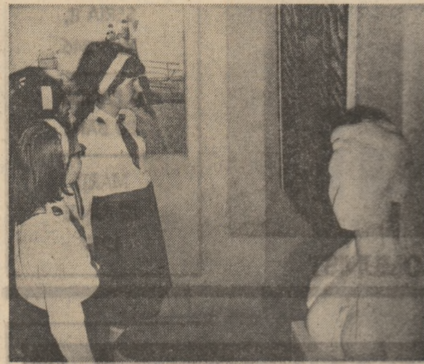
La expoziția națională de artă plastică a tineretului „35 de ani de muncă și împliniri”