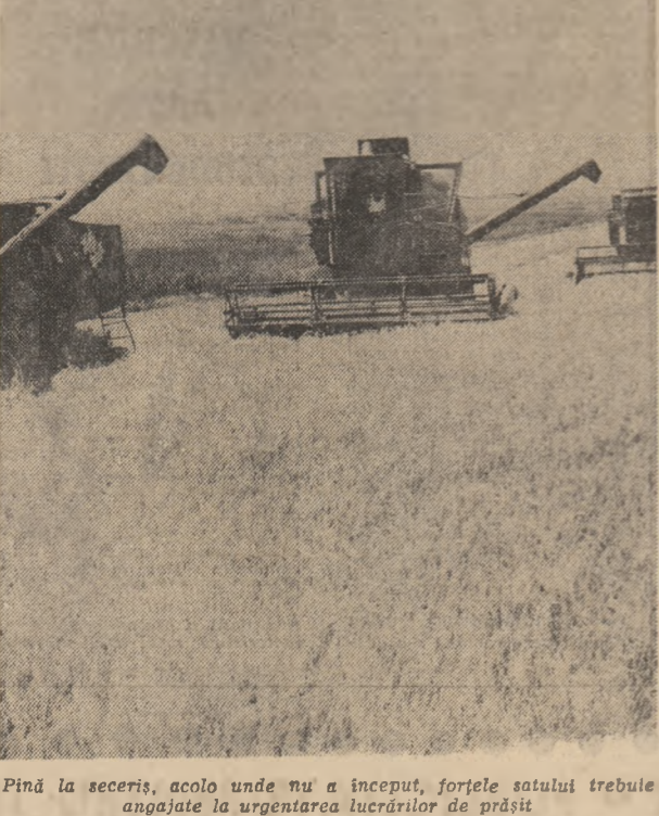
Pină la seceriș, acolo unde nu a început, forțele satului trebuie angajate la urgentarea lucrărilor de prăși

Grînele s-au copit în partea de sud a țării, unde de câteva zile combinele au intrat în lanurile de orz. Este sermul cel mai evident al marea campanie de seceriș a cerealelor păioase se află în plină actualitate. Startul, inițiat cu un avans de circa o săptămână față de anul trecut, impune realizarea unor ritmuri cotidiene sporite, astfel încât recoltele bune din timp să ajungă operativ și fără pierderi în hambare. Iată de ce la nivelul fiecărui consiliu unic agro-industrial munca trebuie organizată în formațiunile specializate care să acționeze pe toată durata zilei-lumină, astfel încât secerișul orzului să se finalizeze în 3-4 zile, iar al grâului în 8-10 zile. În județele unde grînele sînt încă la stadiu de pîrgă, forțele satului sînt concentrate la efectuarea grabnică a lucrărilor de prăși și recoltat furaje, acțiune ce trebuie finalizată pînă la seceriș. De asemenea, este imperios necesar ca acolo unde se simte lipsa apelor din sol să se treacă de urgență la folosirea tuturor resurselor pentru irigațiile culturilor, aflate în perioada de maximă dezvoltare vegetativă, urmărindu-se cu prezență în preajmă furajele și erdările de terum. Gamă largă de lucrări solicită din plin prezența nemijlocită a tinerilor de la saie.