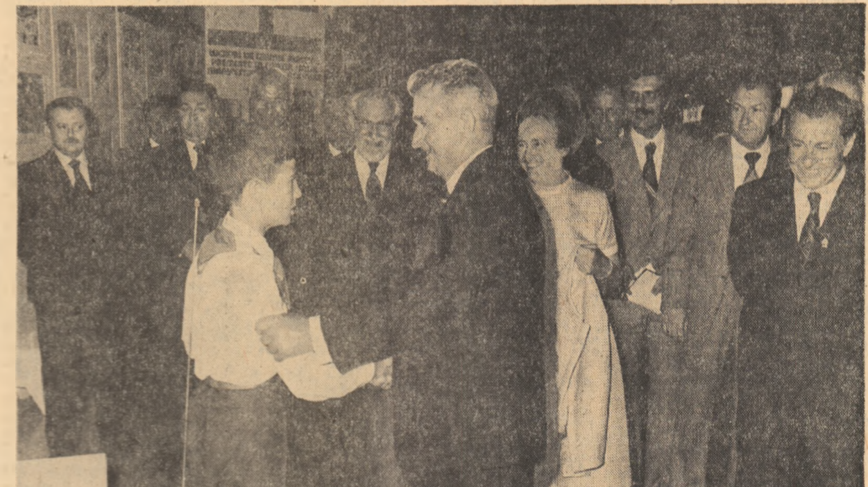
Este vizitată apoi expoziția lucrărilor de creație tehnico-științifică realizate pentru autodotarea cercurilor aplicative din țară sau cu aplicabilitate în diferite domenii ale economiei. Prin intermediul fotografiilor, dar cel mai adesea prin demonstrarea concretă a funcționării instalațiilor, sînt prezentate numeroase lucrări, unele brevete care au invenții și premiate la manifestări științifice de peste hotare. Din multitudinea expozițiilor se remarcă printre altele ministrul realizat de copii din Cimpia Turzii, aparatul electronic pentru consult medical,