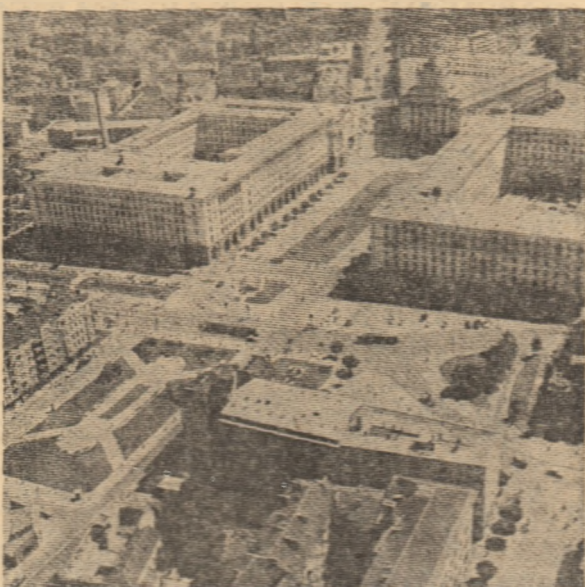
R.P. BULGARIA — Ansambluri arhitectonice moderne la Sofia

Președintele Italiei va începe, săptămîna viitoare, consultări în vederea formării unui nou guvern.