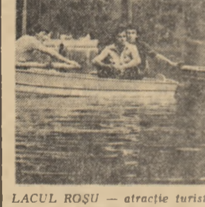
LACUL ROȘU — atracție turistică a vacanței elevilor și studenților