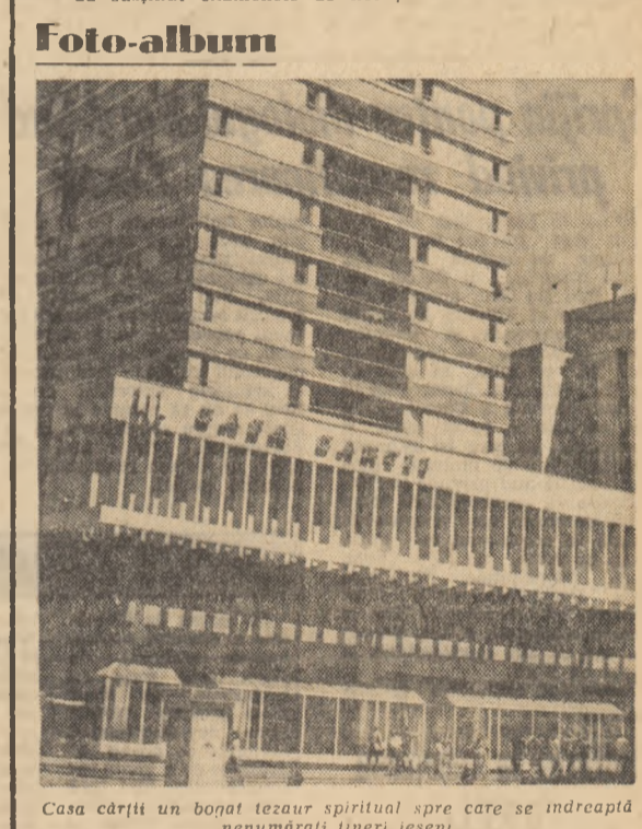
Casa cărții un bogat tezaur spiritual spre care se îndreaptă nenumărați tineri ieșeni

C.C. al U.T.C. organizează azi și mâine, la Centrul de Instruire și perfecționare a cadrelor din industria hotelelor și turistică, la Hotel Pare din Capitală, consultările pe țară privind creșterea și propagarea tehnico-stiințifice în rândul tineretului.