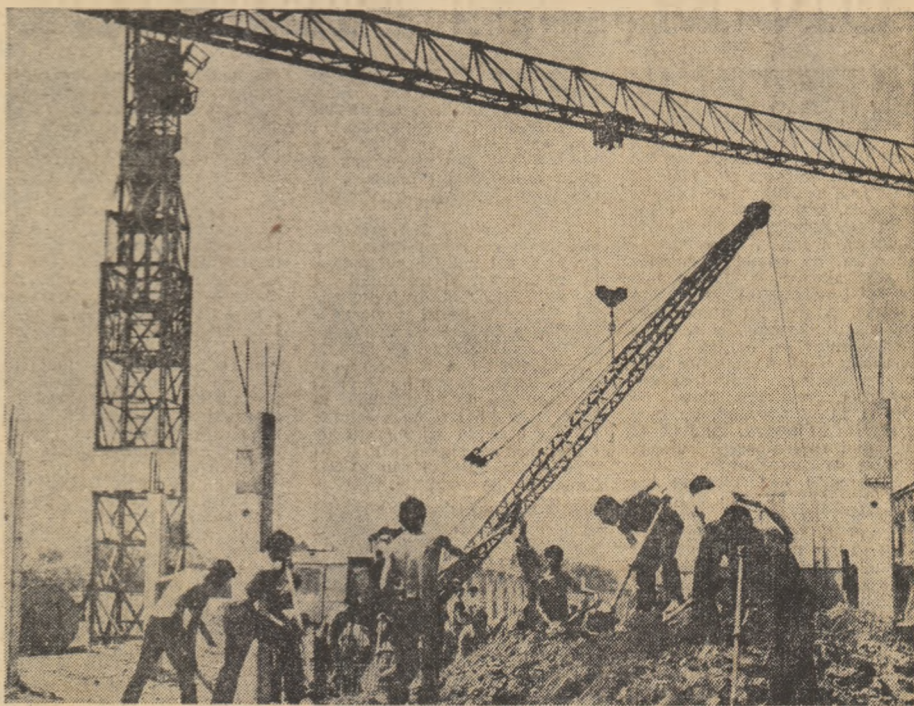
Elevii ai liceului din Roman la muncă patriotică pe platforma chimică a orașului.

șit să îndeparteze apa de pe suprafețele agricole — ne spune tovarășul Andrei Sotir, președintele consiliului unic agroindus-