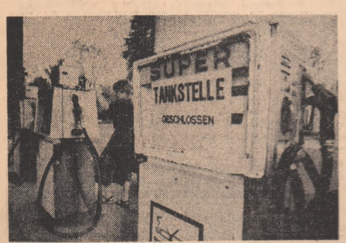
Una din consecințele palpabile ale crizei: stație de benzină închisă în R.F.G.