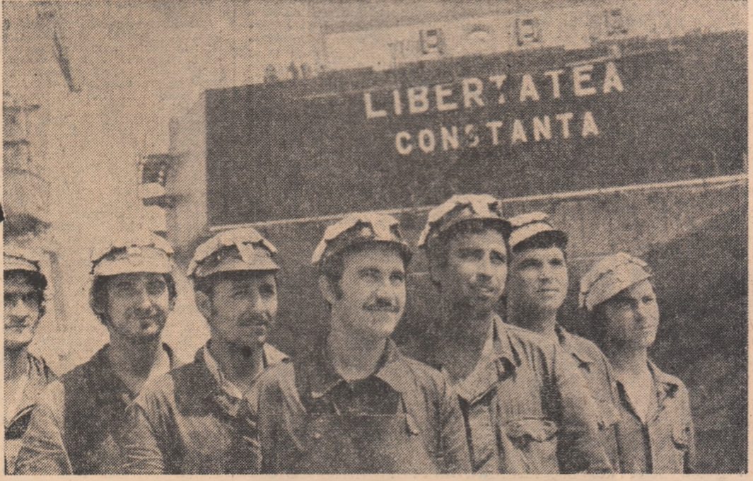
Cîțba dintre tinerii constructori ai celui de-al treilea petrolier de 150.000 tdn.