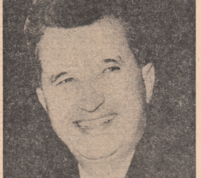
CEAUȘESCU Scrituri scelti 1978 Edizioni del Calendario.

Capitolele final infățișează perspectivele României socialiste pornind de la planul național de dezvoltare economică și socială pe anii 1979-1990. Volumul este bogat ilustrat cu fotografii înfățișând diverse momente din activitatea de tovarășului Nicolae Ceaușescu, cu prilejul vizitelor de prietenie și de colaborare în țările străine și în cadrul Comitetului Comunist Român și cu alte partide democratice din țara noastră. Mi se pare, astfel, că am înțeles în limitele pe care le permite o scurtă prezentare, unele aspecte ale cărora și pot conștientiza stăruind pe unele citiri italiene. Într-un volum înscris în onoarea Partidului Comunist Italian și cu alte partide democratice din țara noastră. Mi se pare, astfel, că am înțeles în limitele pe care le permite o scurtă prezentare, unele aspecte ale cărora și pot conștientiza stăruind pe unele citiri italiene. Într-un volum înscris în onoarea Partidului Comunist Italian și cu alte partide democratice din țara noastră. Mi se pare, astfel, că am înțeles în limitele pe care le permite o scurtă prezentare, unele aspecte ale cărora și pot conștientiza stăruind pe unele citiri italiene.