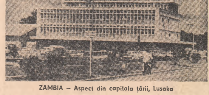
ZAMBIA — Aspect din capitala țării, Lusaka

● CITEVA sute de hulizani, cunoscuți în lumea occidentală sub numele „punk“ (cuvînt argotic englezesc însemnînd „om