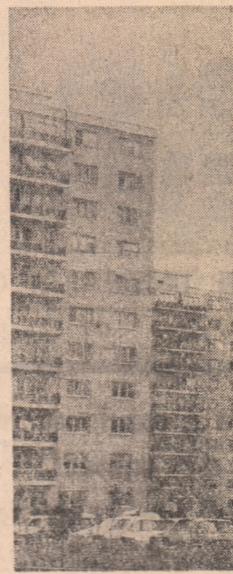
„Călarăși” — un nou cartier al municipiului Drobeta-Tr. Severin.

Președintele Republicii Populare Revoluționare Guineea