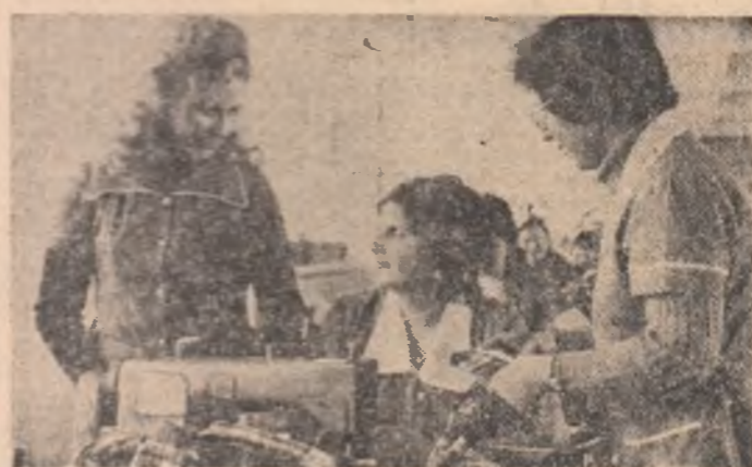
Calitatea — o problemă de conștiință la Întreprinderea de confecții Brăila.

● ENERGETICIENII HIDROCENTRALEI „PORȚILE DE FIER” au îndeplinit luni dimineată sarcinile de plan pe primul patru ani ai actualului cincinal la producția fizică și la alți indicatori economici. Avansul cistigat permite acestui harnic colectiv ca pînă la sfîrșitul anului să furnizeze în plus economiei naționale 2 miliarde kWh energie electrică. Numai în perioada scursă din acest an, pe baza depășirii factorului de putere energetică de la Porțile de Fier au realizat suplimentar o cantitate de energie electrică pentru producția căreia ar fi fost necesar un hidrogenerator de 84,5 MW.