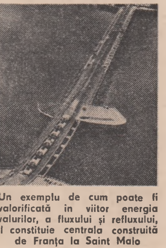
Un exemplu de cum poate fi valorificat în viitor energia vîntului, a fluxului și refluxului, îl constituie centrul construit de Franța la Saint Malo

Industria petrochimică — petrolul a fost utilizat fără deosebire în scopuri (ca producerea de căldură) pentru care se pretau resurse mai puțin prețioase decît „aurul negru”. La aceasta a contribuit un al doilea mit, al fel de dăunător: cel al energiei abundente și ieftine. Comercializat vreme îndelungată la prețuri aproape derizorii, preluate așa din era colonială, petrolul părea să curgă ca un fluviu înfinit. Au fost uitate multă vreme lucruri elementare, care se învăț deja în clasele de gimnaziu, și anume că planeta noastră are limite foarte precise (deci și resursele ei) și că un „perpetuum mobile” nu va putea exista niciodată, deoarece contravine legilor fizicii. S-au neglijat, de aceea, eforturile alt de necesare pentru dezvoltarea capacităților de producere a energiei din surse alternative.