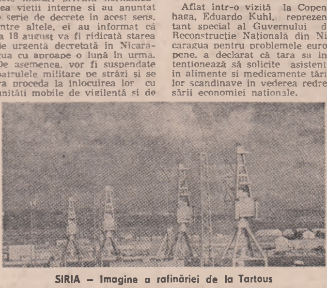
SIRIA — Imagine a rafinăriei de la Tartous

Aflat într-o vizită la Copenhaga, Eduardo Kuhl, reprezentant special al Guvernului de Reconstrucție Națională din Nicaragua pentru problemele europene, a declarat că țara sa intenționează să solicite asistență în alimente și medicamente țărilor scandinave în vederea redresării economiei naționale.