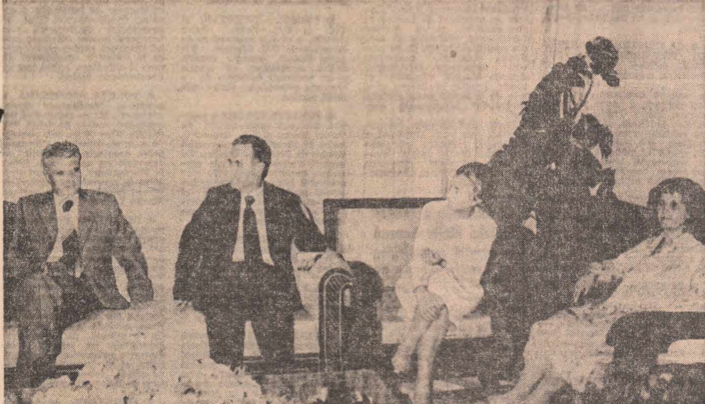
Tovarășa Elena Ceaușescu s-a întâlnit cu doamna Anisse Al-Assad