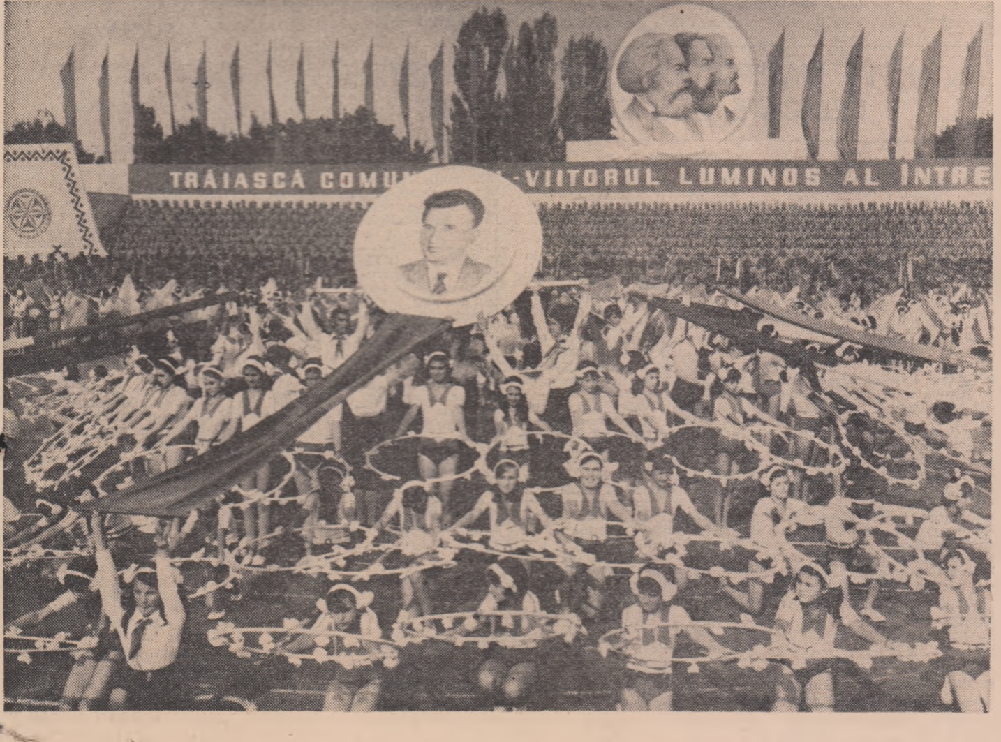
Reportaj realizat de VASILE CABULEA și NICOLAE MILITARU

colectiv, ale fiecărei coloane se scandează puternic: „Ceaușescu — P.C.R. — călăuză noastră”, „Ceaușescu, eroism — România comunistă”, „Ceaușescu, România — pacea și prietenia”, „Pentru pace și progres — Ceaușescu reales, la al XII-lea Congres”. Asemenea cuvinte rostite în această zi, cu semnificație profundă, pe întregul cuprins românesc, de milioane de oameni ai muncii, dau glas simțimentelor patriotice izvorînd din conștiința poporului nostru, care, cu marea și nescută lor înțelepciune știe să aducă cinstire celui ce în fruntea partidului și statului își consacră neobosit fiecare clipă a vieții, binelui și fericirii țării, a tuturor oamenilor muncii din patria noastră socialistă. Demonstrația s-a încheiat într-o atmosferă de vibrant însuflețire, de puternic patriotism. Întreaga asistență intonează imnul „E scris pe tricolor unire”.