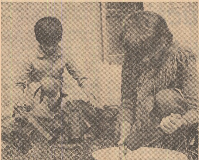
...în loc de munca în cîmp se preferă o activitate care mai suferă aminare