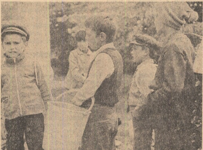
La Școala generală nr. 2 din Tămășești, convocare generală: „Azi ieșim în cîmp la strîns prune“. Dar, stupoare...