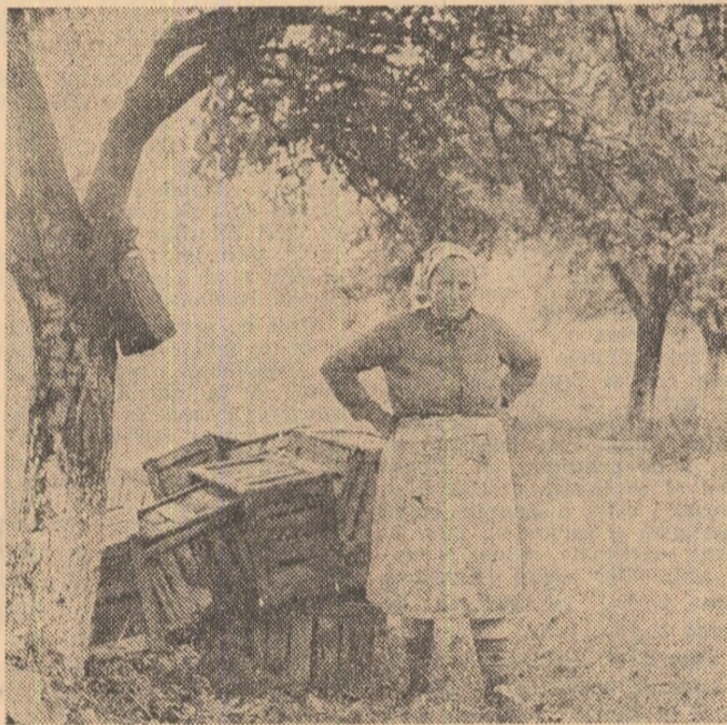
„Ce să fac mai cî? Aștept și eu elevii să mă ajute cî de una singură cîte lăzi de fructe pot stringe?“