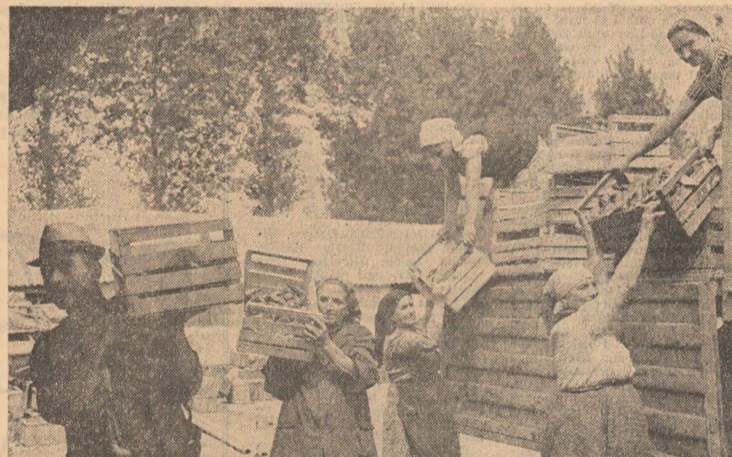
...adevărarii oameni de campanie sînt, totuși, cei care trimit produse depozitelor