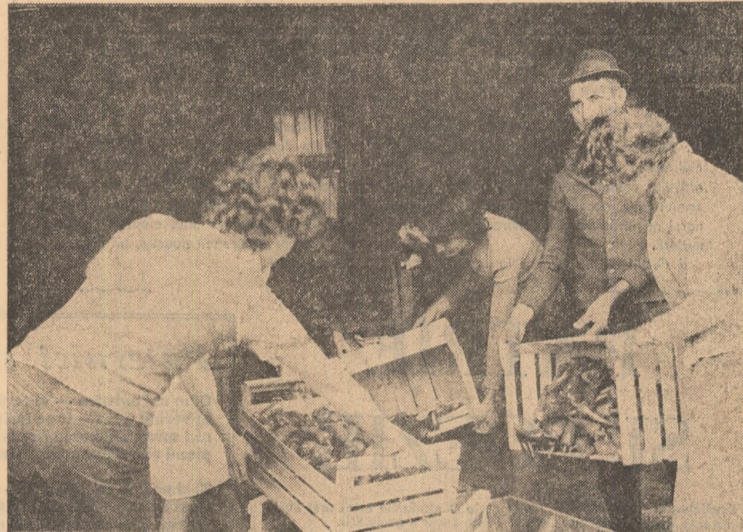
Funcționarele de la C.L.F. Videle la sortat ardei. O secundă a durat, atît cît să fie surprinși în imagine. Pentru că...